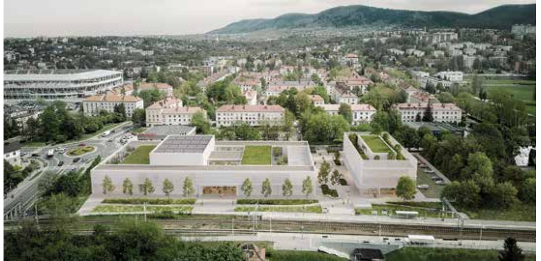
Wizualizacja nowej Banialuki wg zwycięskiego projektu