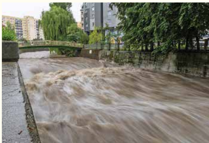
Rzeka Biała pod Ratuszem 4 czerwca rano

3 i 4 czerwca w Bielsku-Białej spadło tyle deszczu, ile normalnie w ciągu miesiąca. Po godz. 5 rano stan wody na Białej w Mikuszowicach wyniósł 196 cm (stan ostrzegawczy 170 cm). Z powodu ponadnormatywnych opadów w wielu miejscach doszło do utrudnień w komunikacji i podtopień. Woda wdarła się do wielu budynków i wyrządziła spore straty.