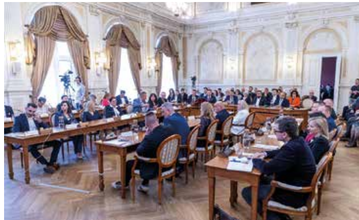
Pierwsza sesja RM nowej kadencji