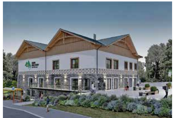
Wizualizacja powstającego domu kultury