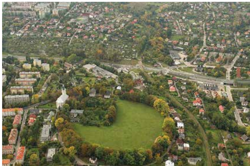
fol. Marek Kocjan / Wikipedia