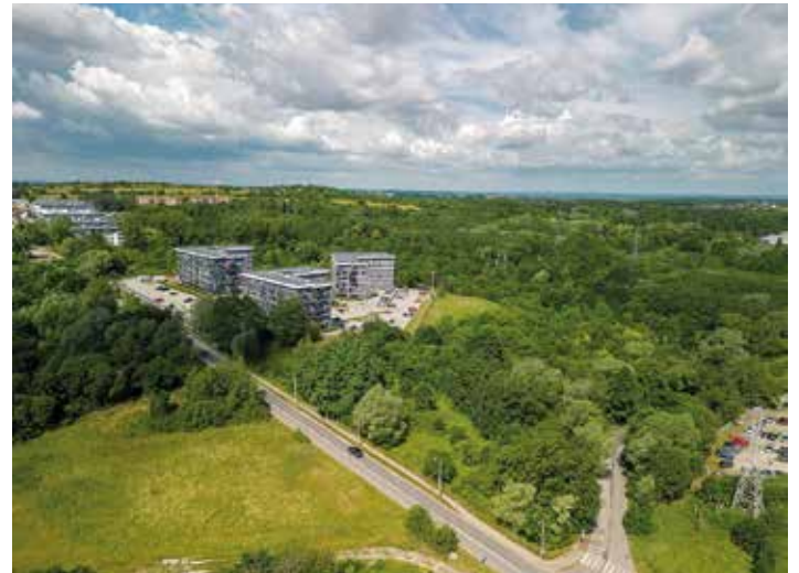
Przyszła lokalizacja zrównoważonego osiedla