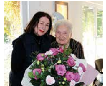
Jubilatka i przewodnicząca RM

Koncert był jednym z wydarzeń realizowanych w ramach projektu pt. Żyj zdrowo i kolorowo , realizowanego przez Stowarzyszenie Akademii Seniora w ramach wieloletniego programu na rzecz osób starszych – edycja 2023, Aktywni+, dofinansowanego przez Ministerstwo Rodziny i Polityki Społecznej. oprac. Jack