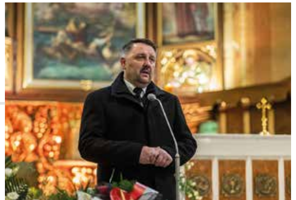
Prezydent Jarosław Klimaszewski