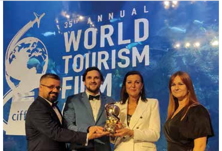
Przedstawiciele Bielska-Białej ze statuetką za zwycięstwo

– To kolejny znak, że liczymy się w dążeniu do uzyskania tytułu Europejskiej Stolicy Kultury 2029. A film – jako