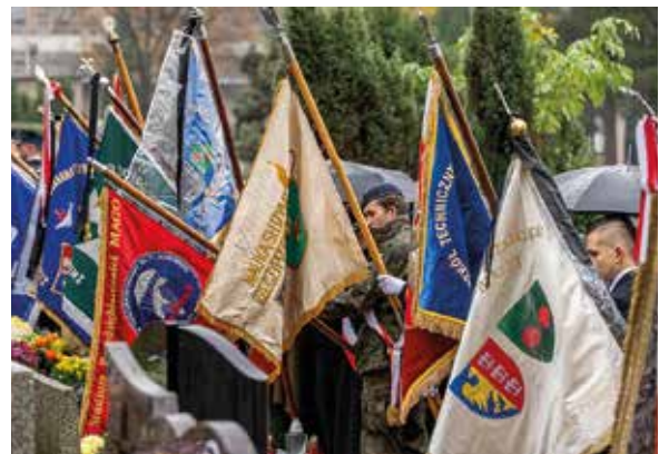
Poczty sztandarowe na cmentarzu