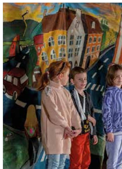
Bądź i Ty bezpieczny