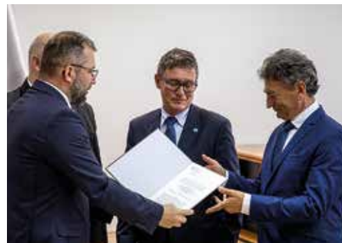
Akt utworzenia filii SUM przekazuje minister Grzegorz Puda

Docelową siedzibą SUM w Bielsku-Białej ma być kompleks budynków na placu Fabrycznym, który wymaga jednak gruntownej modernizacji. Zielone światło do prowadzenia tam inwestycji samorząd