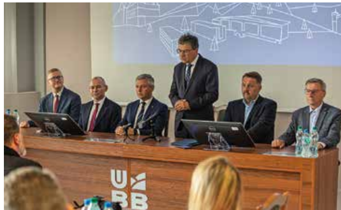
Konferencja prasowa w sprawie UBB

– O Uniwersytecie Bielsko-Bialskim rozmawialiśmy od wielu lat, to był projekt marzeń, ciągle odkładany. Sztafeta pokoleń, która do tego dążyła, na ostatniej prostej miała bardzo dobrych zawodników – ludzi, którzy w sposób profesjonalny potrafili przygotować się do wykorzystania możliwości – mówił