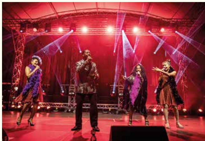
Koncert Boney M.

Za nami już tegoroczne Dni Bielska-Białej. Pogoda, choć nieidealna, pozwoliła zrealizować bogaty program, więc będzie co wspominać. Pierwsze koncerty na nowym placu Wojska Polskiego i przeboje Kory z okna Teatru Polskiego, dziesiątki spotkań, wiele wrażeń, przede wszystkim jednak modę, klimat i energię kolorowych lat 70., lat, które Bielsku-Białej i światu dały małego fiata.