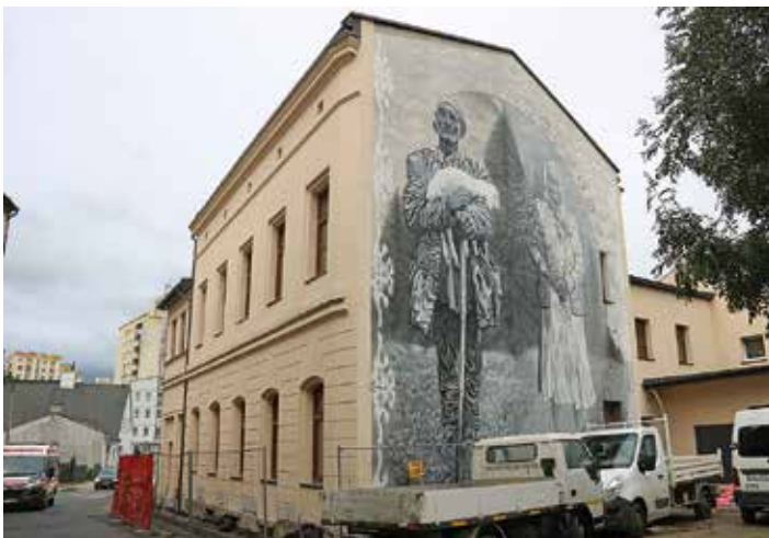
Ul. 11 Listopada 74