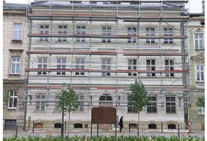
Ul. Cyniarska 14