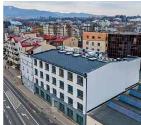
Budynki Centrum Seniorsa przy ul. Romana Dmowskiego