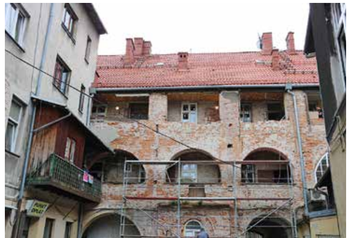
Ul. 11 Listopada 7