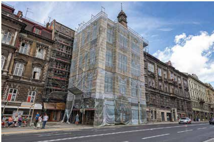
Kamienica przy ul. 3 Maja 5