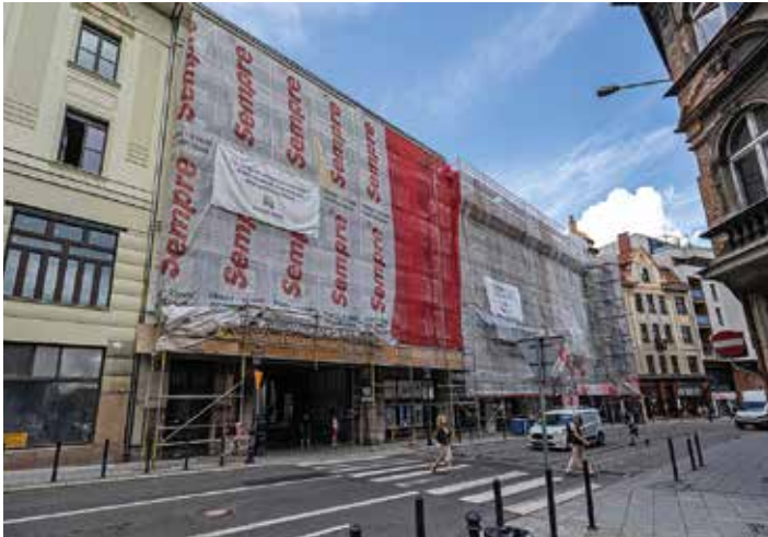
Ul. Barlickiego 1 i 3