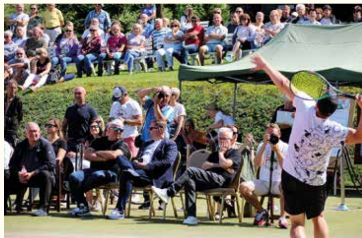
Finał rozgrywek singlowych