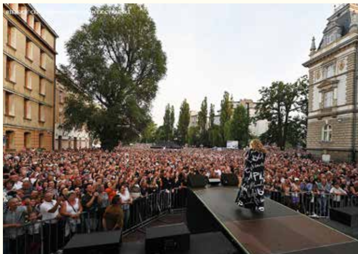
Koncert zespołu Bajm