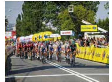
TdP 2020 w Bielsku-Białej

Trasa 80. edycji Tour de Pologne UCI World Tour została zaprezentowana na żywo 19 czerwca w TVP Sport. Przypomnijmy, że piąty etap tegorocznego wyścigu będzie miał metę w Bielsku-Białej.