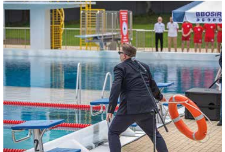
Prezydent Bielska-Białej symbolicznie otwiera basen

Koncepcja doczekała się realizacji. 21 marca 2022 roku w Ratuszu prezydent Bielska-Białej Jarosław Klimaszewski podpisał umowę z wykonawcą inwestycji, Spółką Intravi, która w ciągu 13 miesięcy miała stworzyć nowoczesny obiekt sportowo-rekreacyjny. I tak modernizacja pływalni Panorama w Bielsku-Białej stała się faktem.