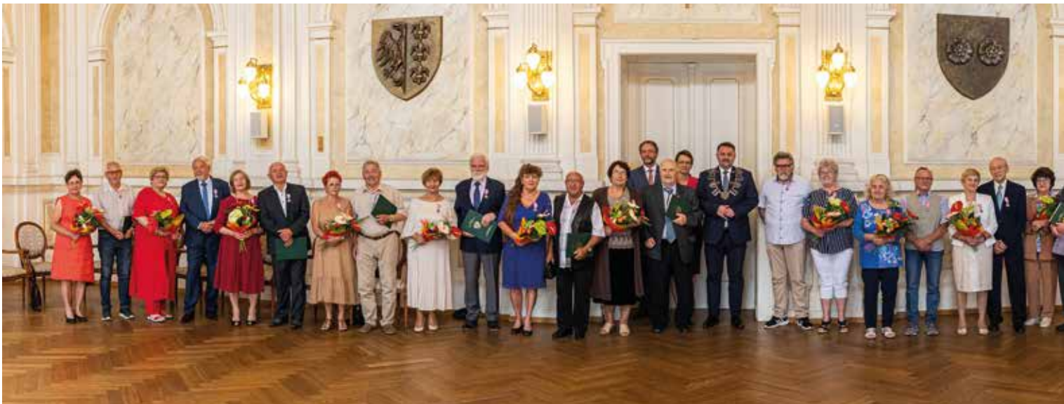
Jubilaci z 22 czerwca