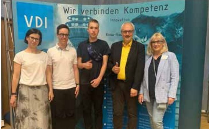
Bielscy uczniowie w Niemczech

Uczniowie V Liceum Ogólnokształcącego w Bielsku-Białej wzięli udział w Forum Młodych Naukowców i Wynalazców na Uniwersytecie Nauk Stosowanych we Frankfurcie nad Menem. Były pokazy eksperymentów, prezentacje i część konkursowa, która zakończyła się dla nas sukcesem. Wyjazd był też okazją do zwiedzania uniwersytetu i samego Frankfurtu nad Menem.