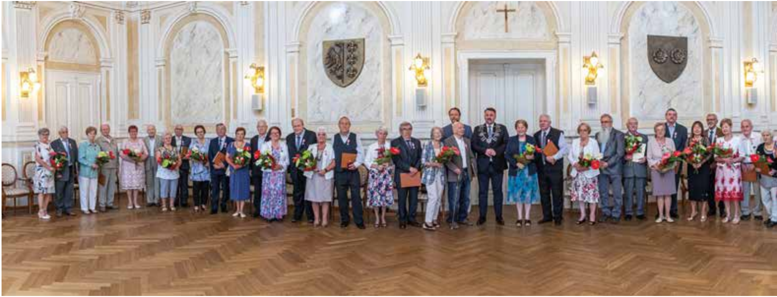
Jubilaci z 21 czerwca