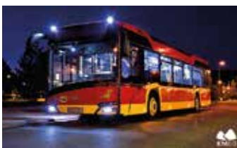
Wydział Komunikacji UM w BB

30 czerwca została otwarta po modernizacji pływalnia Panorama przy ul. Marii Konopnickiej. Dojazd do tego obiektu jest zapewniony liniami nr 15 i 23 – przystanek Konopnickiej Szpital Pediatryczny – a także linią nr 7 – przystanek Browarna.