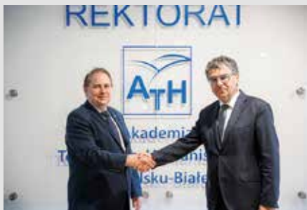
Rektorzy SUM i ATH