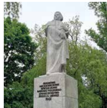
fol. Dariusz Gajny