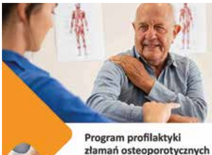
Program profilaktyki złamań osteoporotycznych

Światowa Organizacja Zdrowia (WHO) zalicza osteoporozę do głównych chorób cywilizacyjnych. To istotny problem zdrowotny, który polega na stopniowym zaniku masy kostnej. Choroba nieleczona