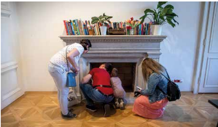
Poszukiwania symboli masońskich w Willi Sixta