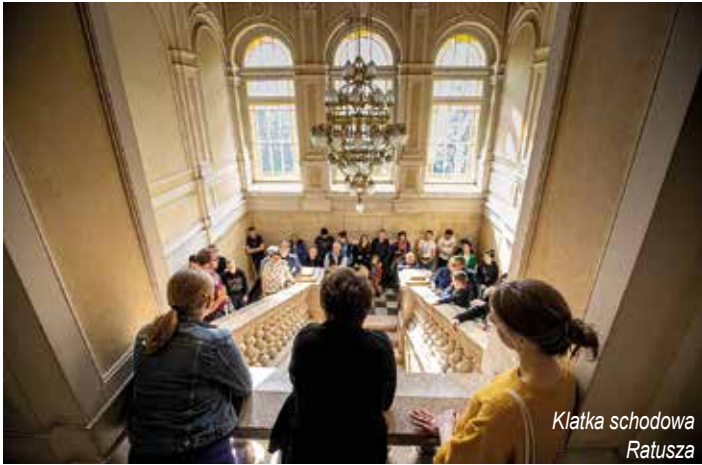
Klatka schodowa Ratusza