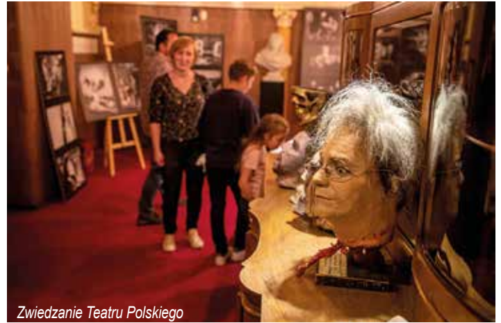
Zwiedzanie Teatru Polskiego