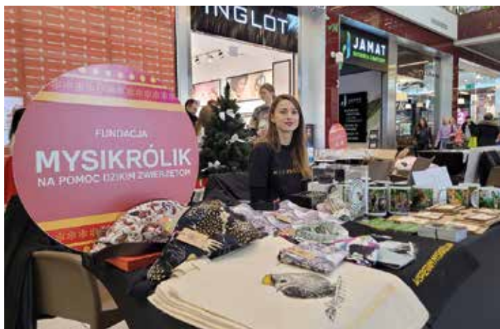
Jedno ze stoisk piknikowych w Gemini Park

10. Jubileuszowy Piknik Organizacji Pozarządowych odbył się 17 grudnia w Centrum Handlowym Gemini Park w Bielsku-Białej. W trakcie pikniku mieszkańcy mogli zapoznać się z działaniami poszczególnych organizacji.