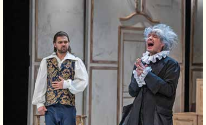
Harpagon z synem