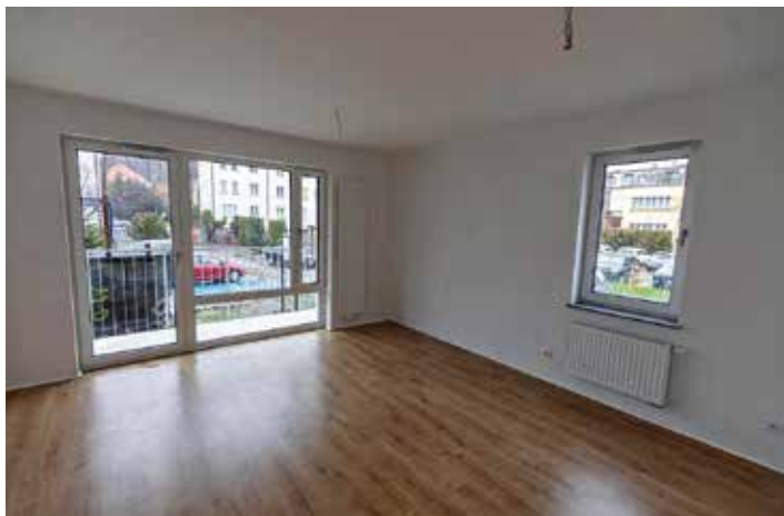
Wnętrze jednego z mieszkań