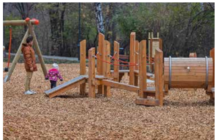
Ekologiczny plac zabaw