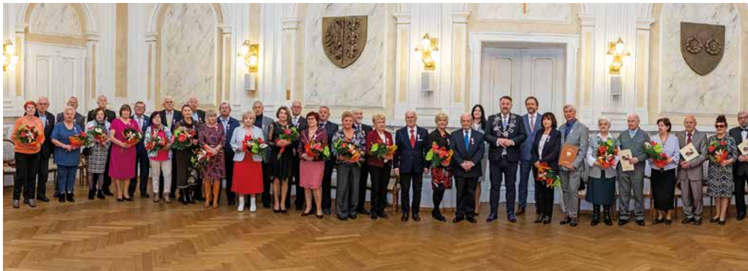
Jubilaci z 16 listopada