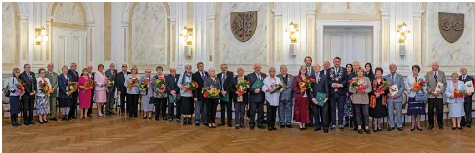
Jubilaci z 17 listopada