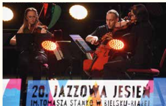
Royal String Quartet