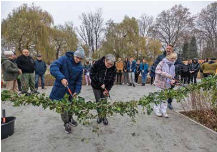
Młodzież z bielskiego Ogrodnika symbolicznie otwiera park po modernizacji