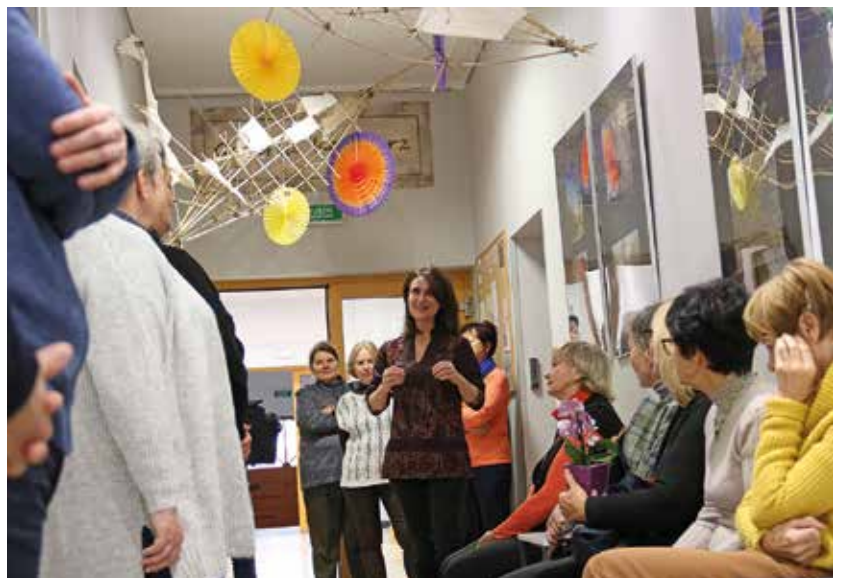
Uczestniczki wystawy z instruktorką