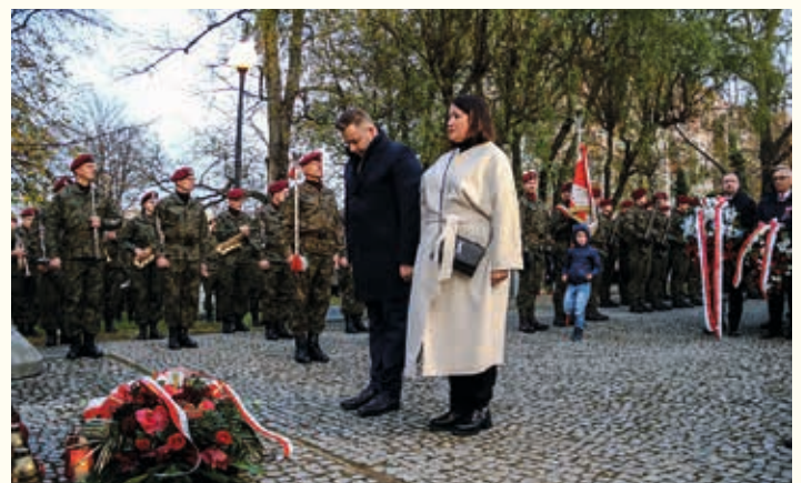
Składanie kwiatów na Cmentarzu Wojska Polskiego