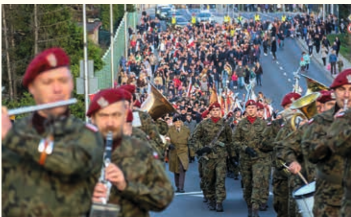
Uroczysty przemarsz ulicą Cieszyńską