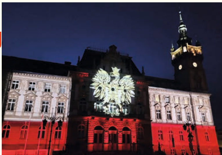
Świątecznie podświetlony Ratusz

– Przecież do upadku Rzeczypospolitej doprowadziły jej elity, przez nieliczenie się z Bogiem, upadek moralny, prywatę, zdradę i kolaborację z wrogami ojczyzny. Walczący o powrót naszego kraju na mapę Europy wiązali niepodległość narodu z wol-