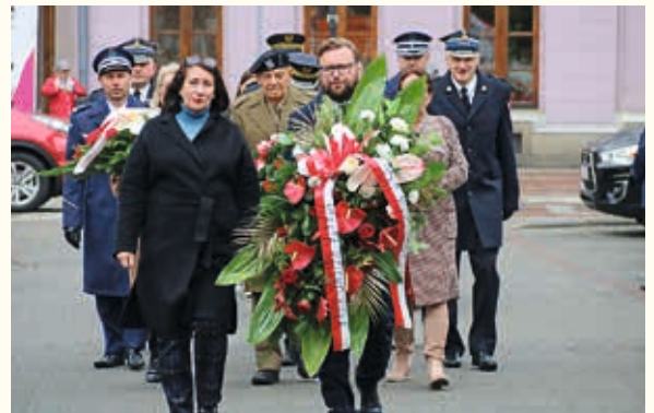
Składanie kwiatów w miejscach pamięci 10 listopada