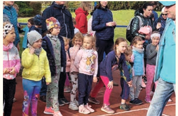
Przedszkolaki biegą dla Niepodległej