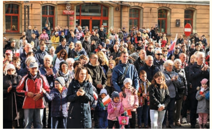
Niepodległa do hymnu