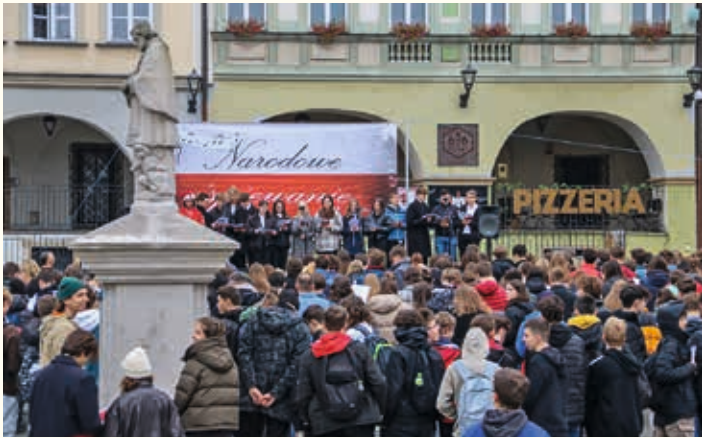
Narodowe śpiewanie pieśni patriotycznych