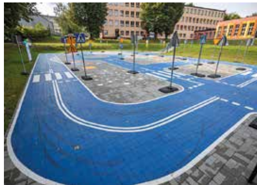
Alejki miasteczka ruchu drogowego