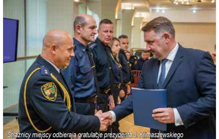
Strażnicy miejscy odbierają gratulacje prezydenta J. Klimaszewskiego

Rok bieżący to również zwiększona liczba patroli wykonanych wspólnie z policją. W ciągu siedmiu miesięcy odbyło się ich ponad 320, co w sposób wybitny wpłynęło na poprawę bezpieczeństwa w mieście.