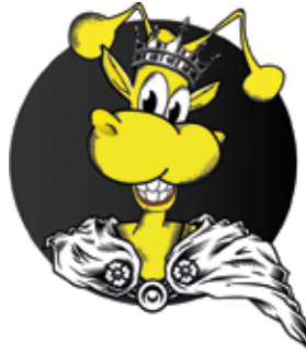
Fermy, czyli logo tegorocznych Fermentów, obok Kabaret Smile