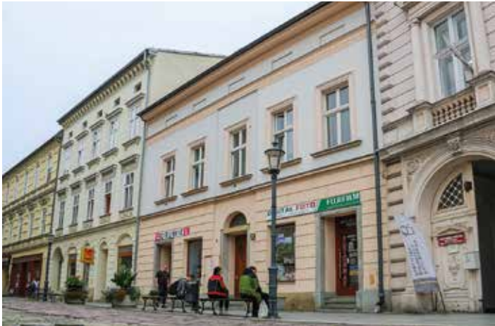
Kamienica przy ul. 11 Listopada