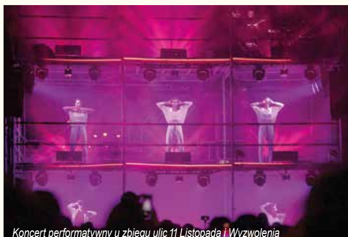
Koncert performatywny u zbiegu ulic 11 Listopada i Wyzwolenia