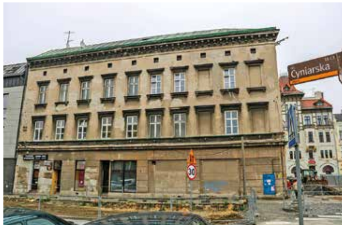
Kamienica przy ul. Cyniarskiej

Środki wydatkowane przez miasto – w ramach własnego budżetu oraz pozyskanych zewnętrznych dofinansowań – dały możliwość przeznaczenia olbrzymich środków finansowych na remonty i modernizację budynków mieszkaniowych. Łączna wartość remontów przeprowadzonych, będących w toku oraz zaplanowanych w okresie 2019-2023 wyniesie ponad 95 mln zł. Jeżeli doliczyć do tego dofinansowania miasta do remontów obiektów wspólnot mieszkaniowych, znajdujących się w rejestrze zabytków, kwota przekroczy 100 mln zł.