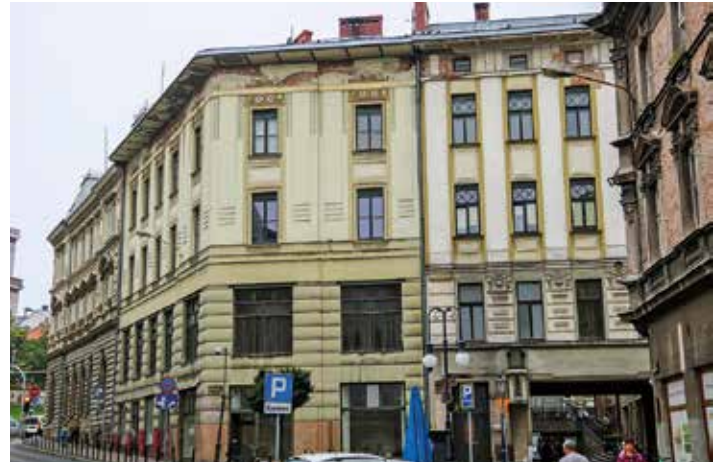
Kamienica przy ul. 11 Barlickiego