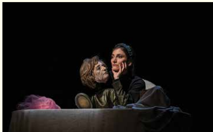
na zdjęciu spektakl Czajka – Grand Prix festiwalu

Widowiskowe spektakle plenerowe, przedstawienia teatrów instytucjonalnych, spektakle kompanii teatralnych, kameralne monodramy, warsztaty, wystawa i czytanie performatywne – wszystko to wypełniło pięciodniowe święto lalkarzy w Bielsku-Białej, 29. Międzynarodowy Festiwal Sztuki Lalkarskiej.