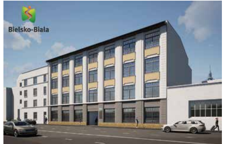
Wizualizacja elewacji od strony ul. Romana Dmowskiego

Przy ul. Romana Dmowskiego w Bielsku-Białej trwają prace przy przebudowie i adaptacji budynków nr 6 i 10. Po remoncie będzie tam Centrum Seniora, powierzchnie biurowe na wynajem dla młodych przedsiębiorców, zielony dach i ściany z pnącą zielenią, a także archiwum i Wydział Geodezji i Kartografii Urzędu Miejskiego w Bielsku-Białej. Lada dzień na siatce zabezpieczającej rusztowania od strony ul. Romana Dmowskiego zawisną wizualizacje obrazujące obiekty po adaptacji, a te robią wrażenie.