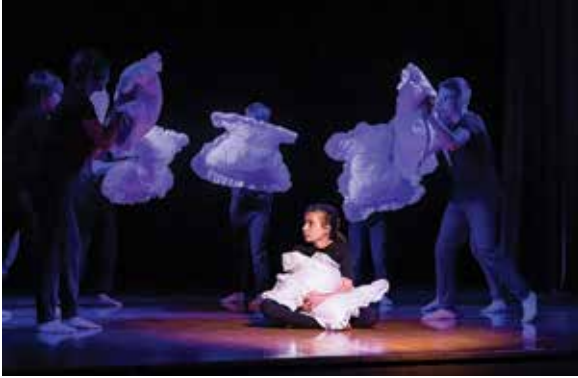
Na zdjęciu fragment spektaklu teatru Coś z nicos Pokojowe strachy z DK im. Wiktorii Kubisz

14 maja w Domu Kultury w Kamienicy odbyła się 31. już edycja Bielskich Spotkań Teatralnych. Od 1991 roku w ramach przeglądu wystąpiło 450 teatrów i około 8.000 młodych aktorów. Tym razem na deskach sceny Domu Kultury w Kamienicy swoje spektakle zaprezentowało siedem grup z Bielska-Białej, ale też całego Śląska i Małopolski. Wszystkie walczyły o Złotą Kurtynę.