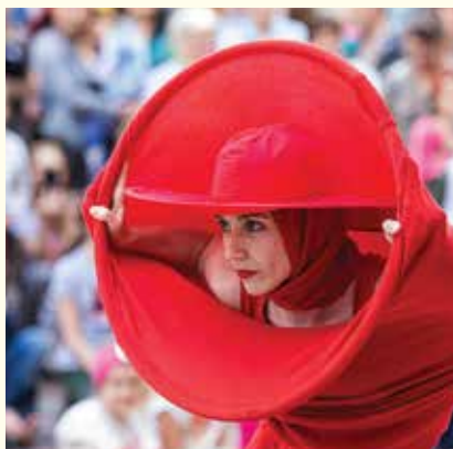
Women in Red Living Picture Visual Theatre