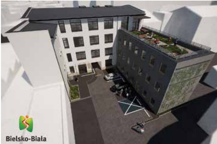
Wizualizacja budynków od strony parkingu, po prawej stronie zielony dach