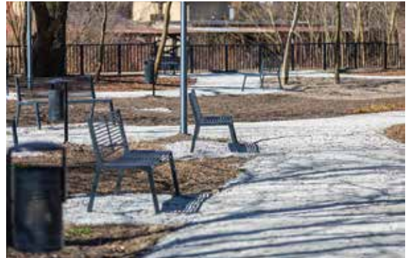
NAPRAWDĘ ŁADNIE (NIE TYLKO) W CYGAŃSKIM LESIE – dokończenie ze str. 1 i 3

Więcej na temat systemu i warunków korzystania z niego na stronie www.bbbike.eu