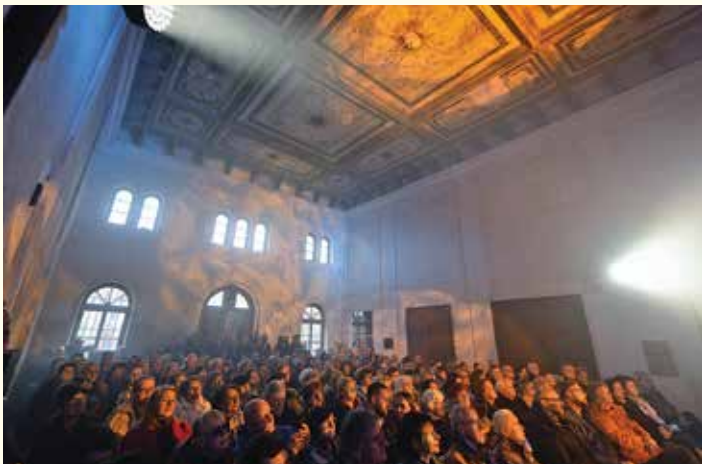
Koncert zespołu NeoKlez w sali ceremonii cmentarza żydowskiego