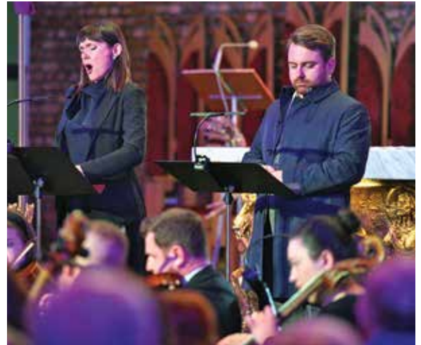
Koncert muzyki barokowej w kościele katolickim na os. Karpackim