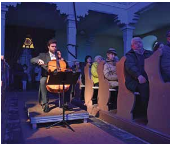
Camerata Silesia wystąpiła w kościele ewangelickim w Starym Bielsku