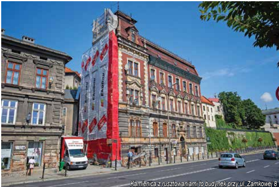
Kamienica z rusztowaniami to budynek przy ul. Zamkowej 8

Budynek przy pl. Wolności 5 został wpisany do rejestru zabytków. Zbudowano go z początkiem XIX w.,