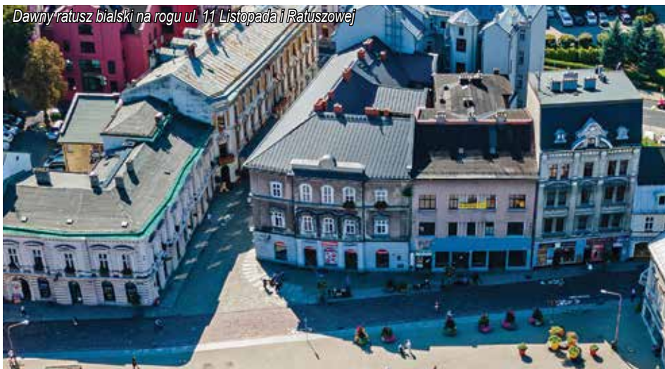
Dawny ratusz bielski na rogu ul. 11 Listopada i Ratuszowej

prawdopodobnie w 1812 roku jako dom barokowo-klasycystyczny w tzw. stylu józefińskim z charakterystycznym wysokim, łamanym dachem.