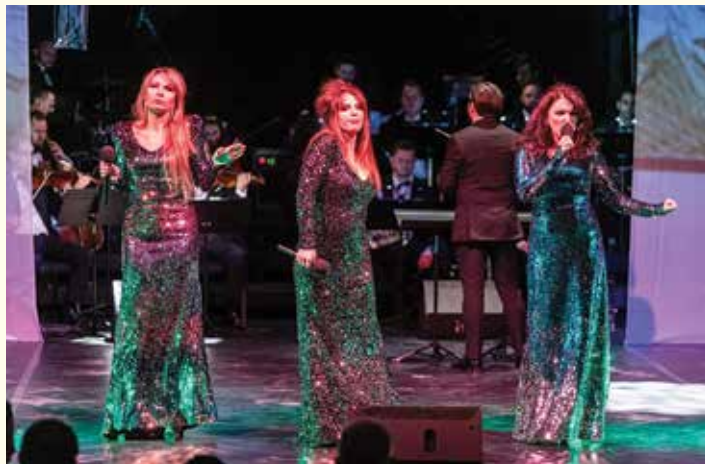
Karuzela pani Marii, fot. Paweł Sowa

Tradycją Teatru Polskiego stało się, że Nowy Rok wita się w nim na wesoło, nową komedią, która oficjalną premierę miała w Święto Trzech Króli. Tak było i w tym roku, kiedy zaproponowano dzieło jednego z najpopularniejszych amerykańskich autorów sztuk teatralnych na wesoło Kena Ludwiga, w oryginale opatrzone tytułem A Comedy of Tenors .