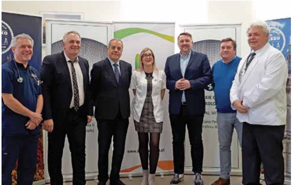
Uczestnicy spotkania w BCO-SM

I wydaje się, że wszystko leży w granicach możliwości. Bowiem dzięki opracowanej przez profesora specjalnej matrycy genetycznego badania krwi nie trzeba badać całego genotypu, jak to się działo dotychczas. Ograniczenie liczby badanych genów do genów charakterystycznych dla poszczególnych rodzajów nowotworów obniży koszt badania do kilkuset złotych.