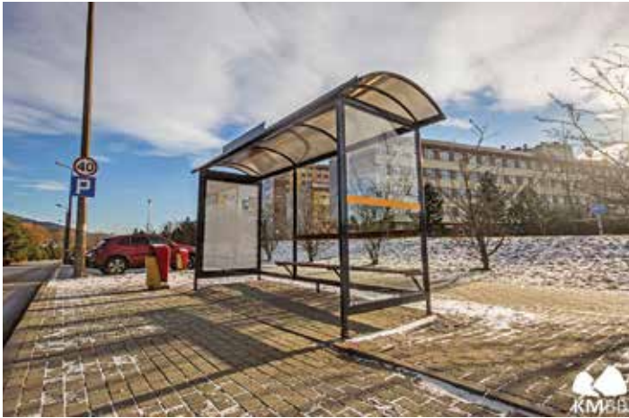
Przystanek Boboli Szpital Wojewódzki