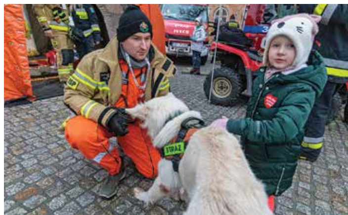
Spotkanie z psem ratowniczym z Hecznarowic