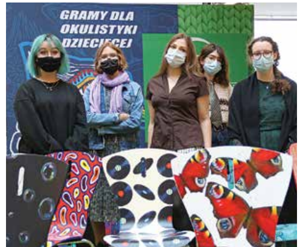
Autorki krzesel na licytację ze swoimi dziełami