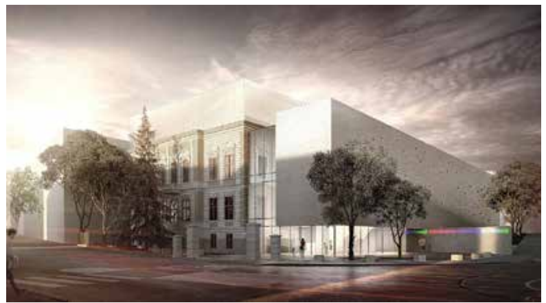
Wizualizacja przyszłego Centrum Bajki i Animacji