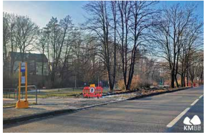
Na ul. Górskiej trwa budowa peronów przystankowych