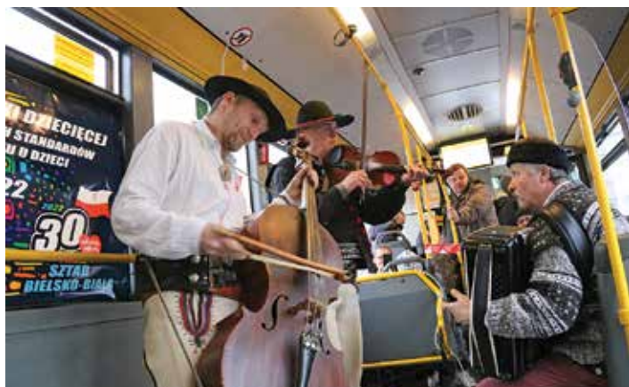
Koncert zespołu PsioCrew w specjalnym autobusie MZK