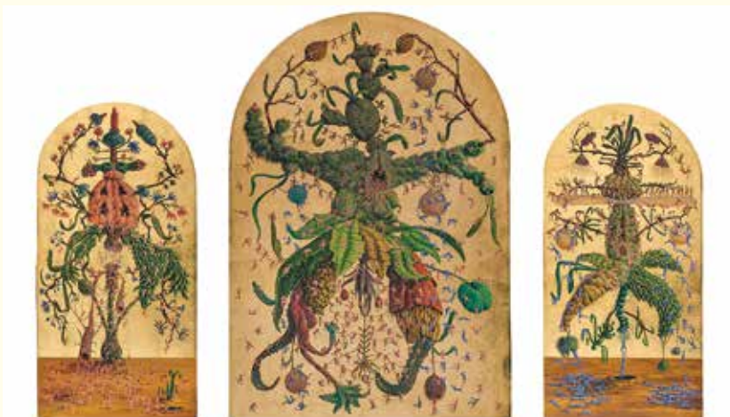
Tomasz Kulka, Game over (tryptyk), 2021, tłusta tempera na desce, szlag metal