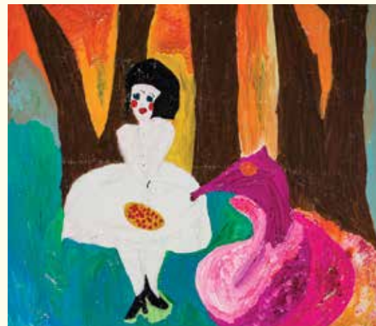
Olga Maria Dmowska, Nienasylenie , 2019, akryl na płótnie

DO TYCH OBRAZÓW TRZEBA WRACAĆ – dokończenie ze str. 1 i 3 Najmłodszy z uczestników ma 19 lat, najstarszy 85. Na ekspozycję trafiło 121 prac 84 artystów – 38 kobiet i 46 mężczyzn. Najmniejszy obraz ma wymiary 19x29 cm, największy – 2,5x2 m.