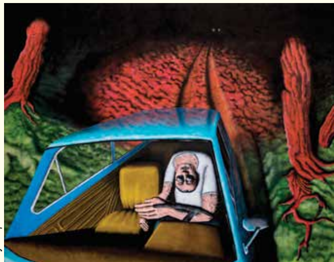
Adam Kozicki, Too Late for Late Capitalism , 2021, akryl na płótnie