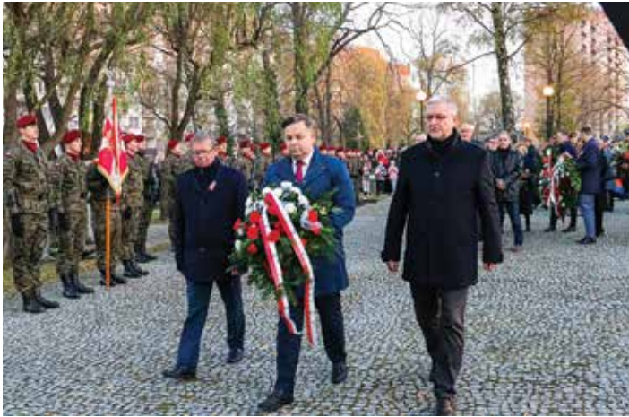
Przedstawiciele samorządu Bielska-Białej składają kwiaty na cmentarzu WP