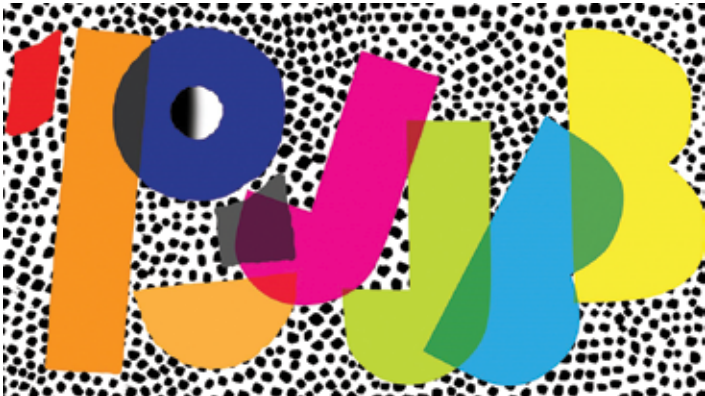
Logotyp 19. Jazzowej Jesieni w Bielsku-Białej im. Tomasza Stańko