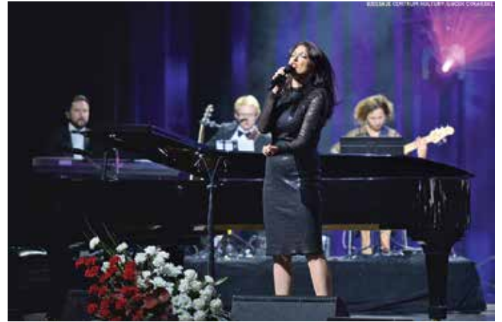
Koncert dla Niepodległej w BCK