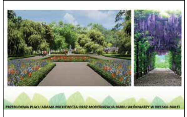
Wizualizacja placu Adama Mickiewicza