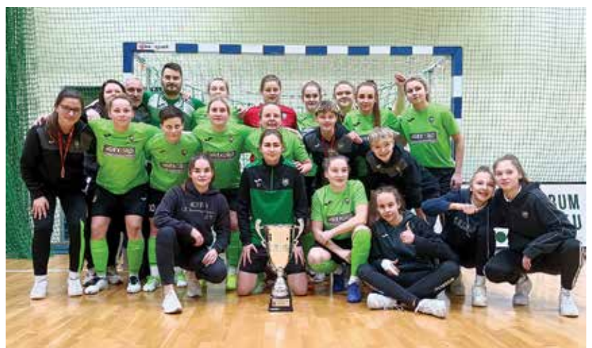
Młode zawodniczki klubu Rekord

System Sportu Młodzieżowego został zainicjowany w 1994 roku i adresowany jest do uzdolnionej młodzieży. Zespół Sportu Młodzieżowego powstał w Instytucie Sportu – Państwowym Instytucie Badawczym w Warszawie w roku 2013. Głównym zadaniem zespołu było opracowanie i wdrożenie do pilotażu programu Multisport , którego idea była upowszechnienie aktywności fizycznej wśród uczniów klas IV-VI szkół podstawowych poprzez ich udział w regularnych i bezpłatnych zajęciach sportowych. Jednocześnie zespół współpracował z Departamentem Sportu dla Wszystkich Ministerstwa Sportu i Turystyki przy projektowaniu kolejnych programów adresowanych i opo-