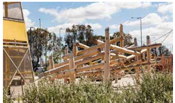
Konstrukcja wspinaczkowa