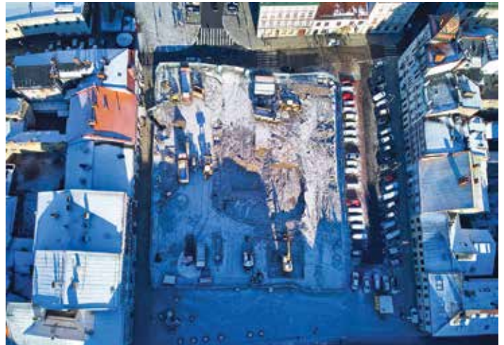
Przebudowa pl. Wojska Polskiego

Od połowy grudnia pełną parą ruszyły prace związane z rozbudową ulicy Cyniarskiej oraz placu Wojska Polskiego. Dwumiesięczny przestój był spowodowany oczekiwaniem przez miasto na decyzję Śląskiego Wojewódzkiego Konserwatora Zabytków, zezwalającą na badania archeologiczne prowadzone w formie nadzoru archeologicznego. Po uzyskaniu stosownego pozwolenia wykonawca – już pod stałym nadzorem archeologa – rozpoczął prace rozbiórkowe, wyburzeniowe, budowę kanalizacji deszczowej oraz zbiornika retencyjnego.