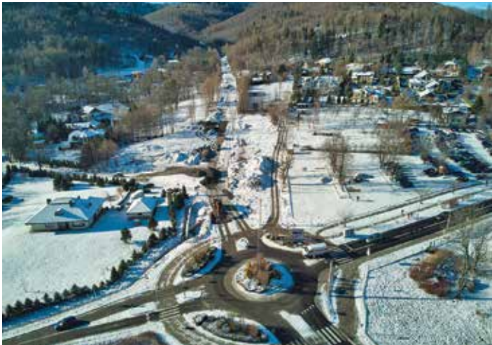
Remont odcinka al. Armii Krajowej

Zima, choć zmienna, pozwoliła kontynuować rozpoczęte wcześniej inwestycje drogowe w Bielsku-Białej. Drogowcy korzystają więc z okazji, działając tam, gdzie to jest możliwe. Największe roboty prowadzone są w rejonie placu Wojska Polskiego, ulicy Łowieckiej i alei Armii Krajowej.