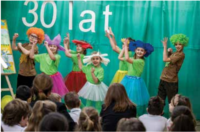
Program artystyczny w wykonaniu dzieci