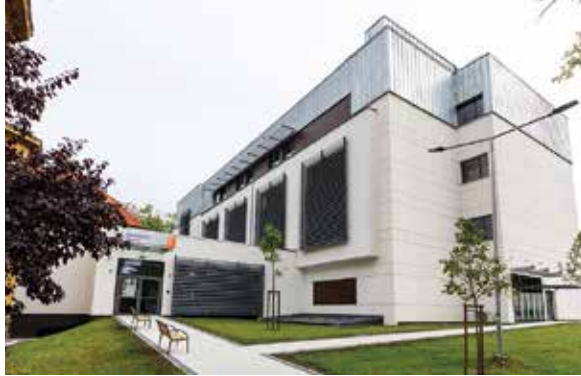
Nowy budynek BCO-SM