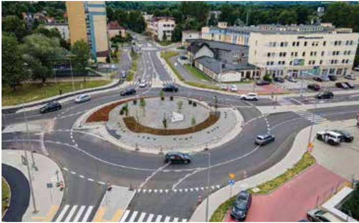
Rondo na skrzyżowaniu ulic Cieszyńskiej i Wapienickiej

Konsultacje z organizacjami prowadzącymi działalność pożytku publicznego projektu uchwały w sprawie nadania ronda na skrzyżowaniu ulic Cieszyńskiej i Wapienickiej w Bielsku-Białej nazwy Bronisława Kokotka będą trwały od 29 listopada do 12 grudnia br. Celem jest zebranie opinii i sugestii ws. projektu uchwały.