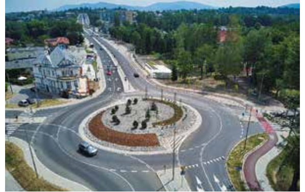
Przebudowana ulica Cieszyńska

Na konkurs wpłynęło do 158 zgłoszeń, wśród nich dwa z Bielska-Białej. Do konkursu zgłoszona została rozbudowa Beskidzkiego Centrum Onkologii – Szpitala Miejskiego w Bielsku-Białej oraz rozbudowa odcinka drogi wojewódzkiej nr 942 w Bielsku-Białej, czyli ul. Cieszyńskiej.