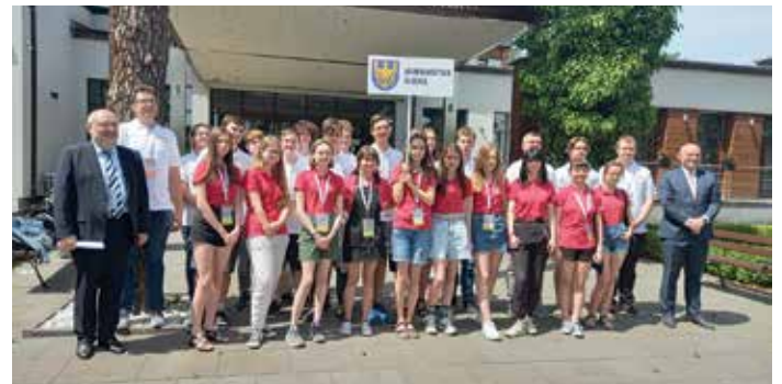
Zawodnicy Beskidzkiego Stowarzyszenia Brydża Sportowego