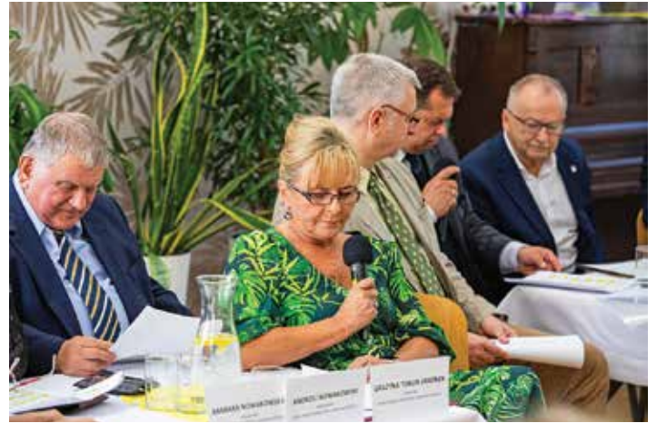
Czytanie w Domu Nauczyciela