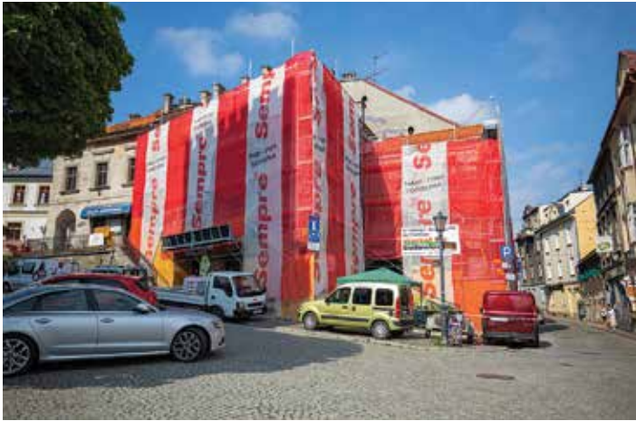
Kamienica przy ul. Wzgórze 11