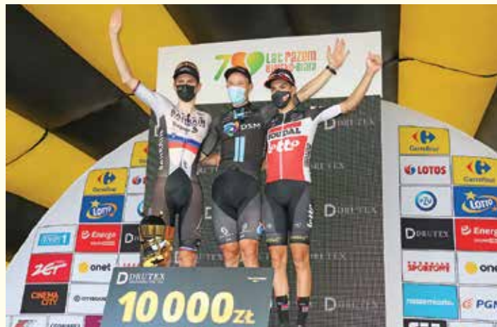
Zwycięzcy 5. etapu Tour de Pologne na podium