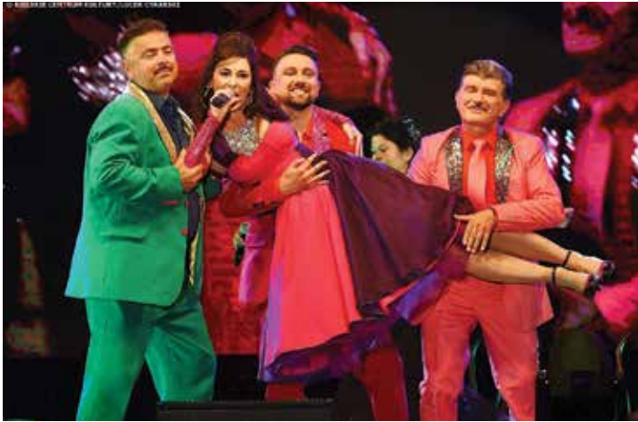
Koncert Viva Italia!