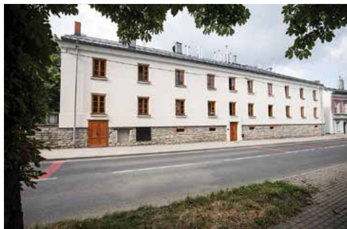
Pięknie odnowiony budynek przy ul. Lipnickiej 70

Kolejny remontowany budynek mieści się przy ul. Żywieckiej 131. W nim również będzie nowy dach, elewacja, wyremontowana klatka schodowa, wymieniona zostanie stolarka okienna i drzwiowa, kominy, remontowane i prze-