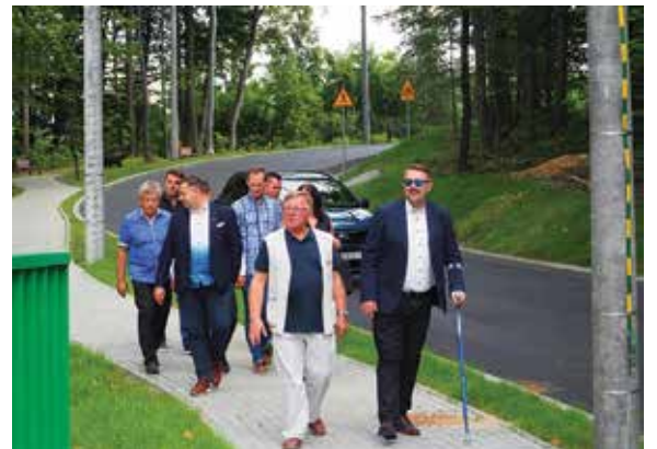
Wizytacja na ul. Falistej

Zakres inwestycji obejmował rozbudowę ulicy na odcinku 1,186 km wraz z przebudową nawierzchni zjazdów. Wybudowano mijanki oraz na końcu – plac do zawracania. Rozbudowa polegała na całkowitej wymianie