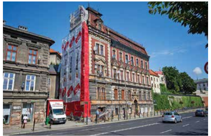
Kamienica przy ul. Zamkowej 8 – rusztowania od strony ul. Schodowej