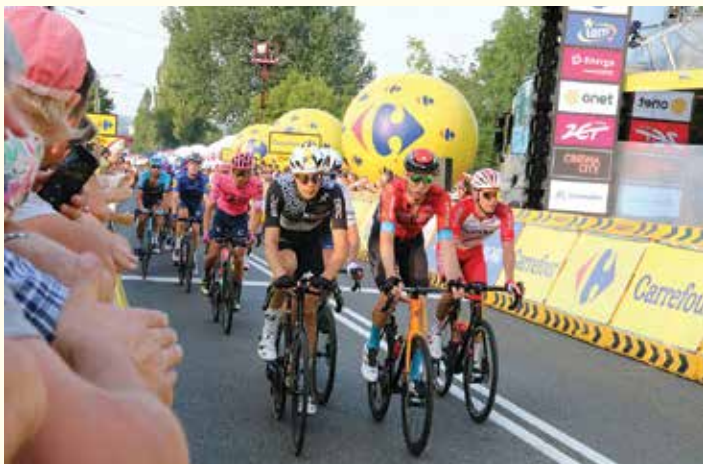
Finisz 5. etapu Tour de Pologne