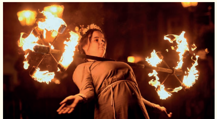
Teatr Ognia Tesseract