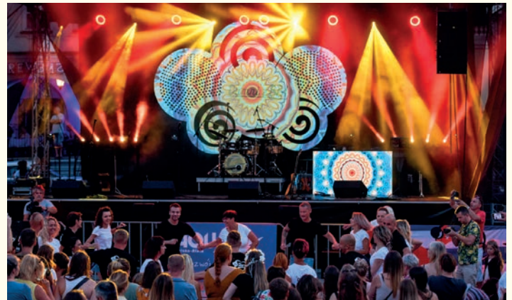
Kubańska impreza na Rynku