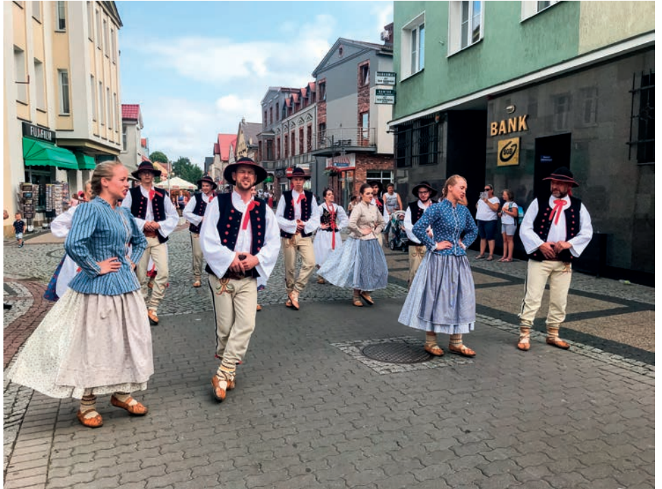
Zespół Pieśni i Tańca Beskid na usteckiej ulicy

– Na tej wystawie pokazujemy to, co dotyka każdej z nas – piękno, niedoskonałość i akceptację tej