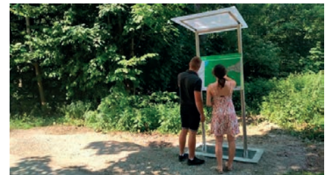
Edukacyjna ścieżka przyrodnicza

Przy wejściu na ścieżkę umieszczono plan tyflograficzny (dotykowy) okolicy, który pomoże w zorientowaniu się w terenie osobom niewidomym i słabowidzącym. Do potrzeb tych osób przystosowane zostały ponadto wszystkie pozostałe stanowiska edukacyjne. Służy temu system nadajników YourWay. By korzystać z systemu, potrzebny jest telefon komórkowy i aplikacja YourWay. Można ją bezpłatnie pobrać ze sklepu Android lub iOS. By ułatwić nawigację, kody QR do strony, z której można pobrać aplikację, umieszczono między