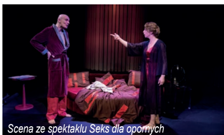
Scena ze spektaklu Seks dla opornych

Przypominamy, że Teatr Polski w Bielsku-Białej gra w lipcu. Ostatnie przed sierpniową przerwą urlopową spektakle to 30 i 31 lipca o godz. 19.00 Seks dla opornych .