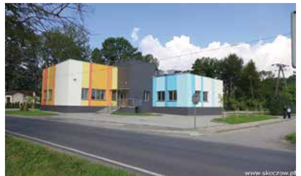
Przedszkole w Pierścicu