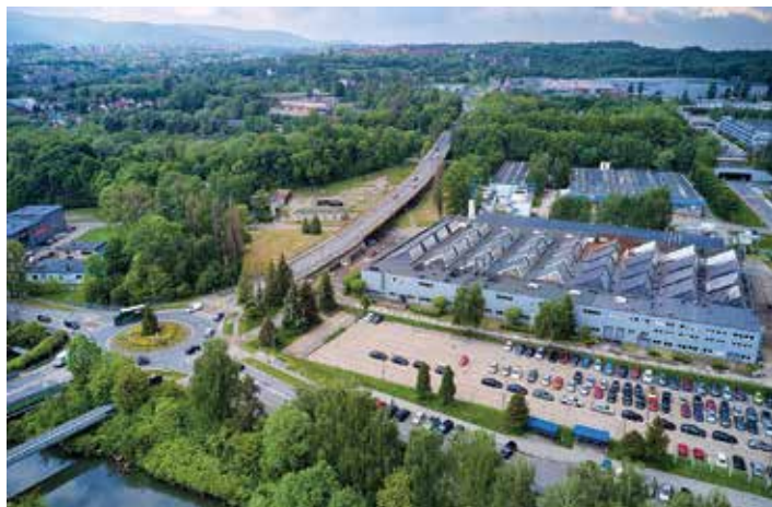
Widok z drona na ul. Eugeniusza Kwiatkowskiego