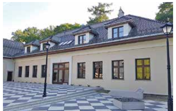
Centrum Aktywności Lokalnej w Łodygowicach