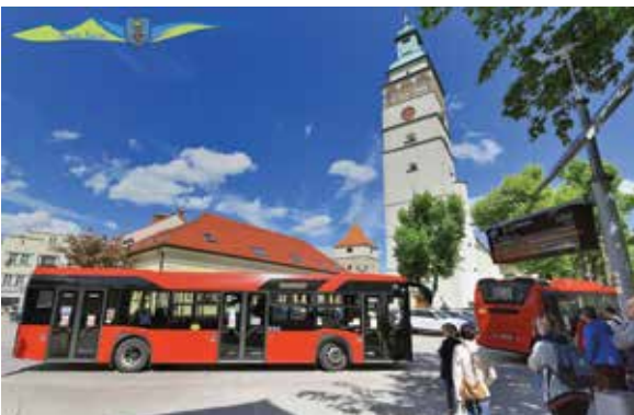
Nowe autobusy w Żywcu