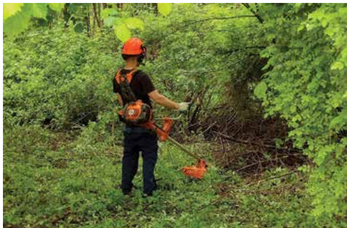
Utrzymanie terenów zielonych przy ul. Dzwonkowej

Siedziba Spółdzielni Socjalnej Synergia mieści się w Bielsku-Białej przy al. Armii Krajowej 220.