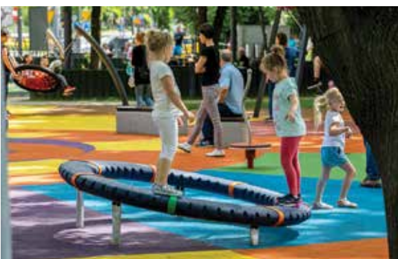
Aktywne przestrzenie – rewitalizacja terenów miejskich w Bielsku-Białej, źródło: UM w BB

W Polsce realizowane są 24 ZIT/RIT, z czego cztery w województwie śląskim w ramach subregionów: centralnego, zachodniego, północnego i południowego. Subregion południowy obejmuje powiaty: bielski, cieszyński i żywiecki oraz miasto Bielsko-Biala. W maju bieżącego roku rozstrzygnięto ostatni nabór dedykowany RIT subregionu południowego. W związku z tym możliwe jest pierwsze podsumowanie działań realizowanych w subregionie dzięki środkom RIT dla subregionu.