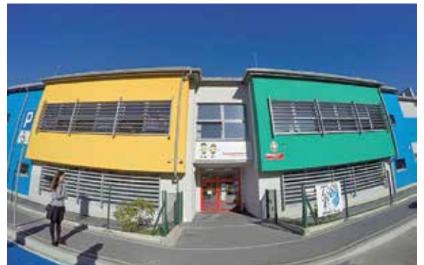
Przedszkole integracyjne w Żywcu-Zablociu, źródło własne