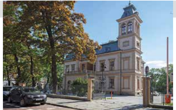
Willa Sixta w Bielsku-Białej