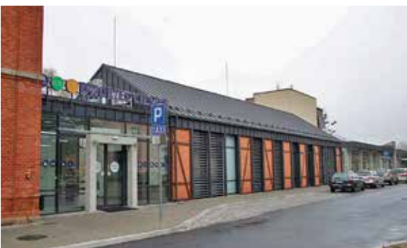
Węzeł przesiadkowy w Cieszynie