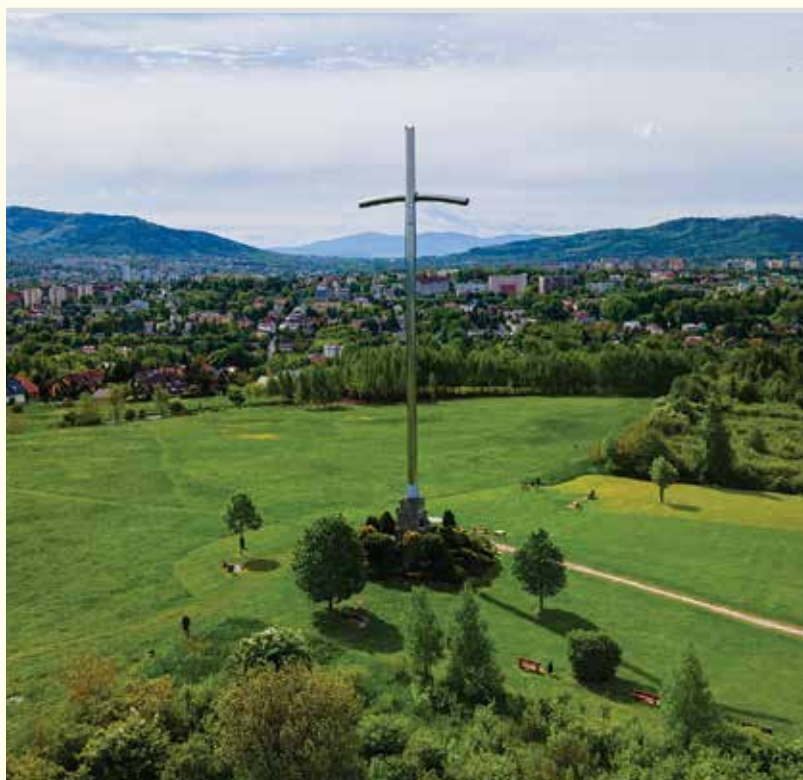
Wzgórze Trzy Lipki

Lasek Bathelta, ul. Pieczarkowa, Trzy Lipki, ujście potoku Straconka do rzeki Białej, plac przy Szkole Podstawowej nr 25, Las Cygański i Wapienica – to lokalizacje, w których lada moment rozpoczną się roboty budowlane związane z projektem Rewitalizacja miejskich systemów nadbrzeżnych wraz z utworzeniem Centrum Edukacji Ekologicznej w mieście Bielsko-Biała .