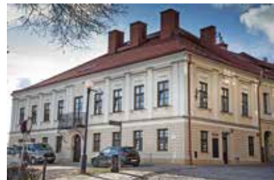
Bielskie Centrum Usług Społecznościowych

Szersze informacje na ten temat dostępne są na stronie https://aglomeracjabeskidzka.eu/ . ISZN