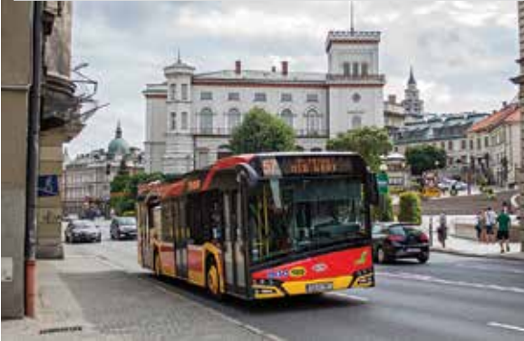
System ITS w Bielsku-Białej

Regionalne Inwestycje Terytorialne (RIT) są elementem wdrażania funduszy europejskich, dzięki któremu część środków pozostawiona jest w zarządzanie związkom lokalnych samorządów. Wprowadzone w perspektywie finansowej 2014-2020 bardzo pozytywnie wpłynęły na skuteczność pozyskiwania środków unijnych przez niewielkie gminy, ale także efektywność wydatkowania funduszy dzięki zintegrowaniu działań.