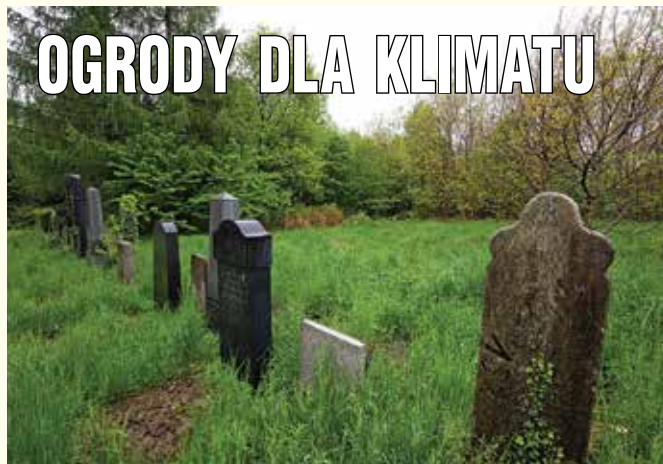
Na Cmentarzu Żydowskim powstanie Tajemniczy Ogród

Tajemniczy i Różany – to dwa ogrody edukacyjne, które powstaną w Bielsku-Białej. Pierwszy z nich zostanie założony na części cmentarza żydowskiego przy ul. Cieszyńskiej, drugi na terenie Willi Sixta. To wspólna inicjatywa miasta i Stowarzyszenia Ekologiczno-Kulturalnego Klub Gaja w ramach projektu Święto Drzewa – ogrody dla klimatu.