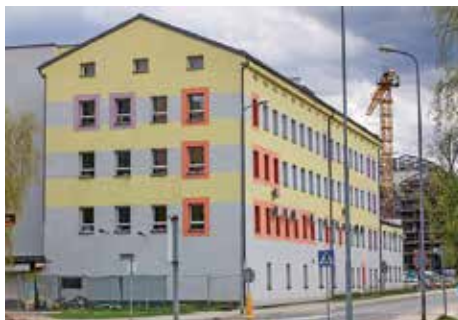
Siedziba stowarzyszenia Teatr Grodzki – po rewitalizacji powstanie tu teatr społecznościowy

Natomiast w ramach projektu Nowe życie w sta-