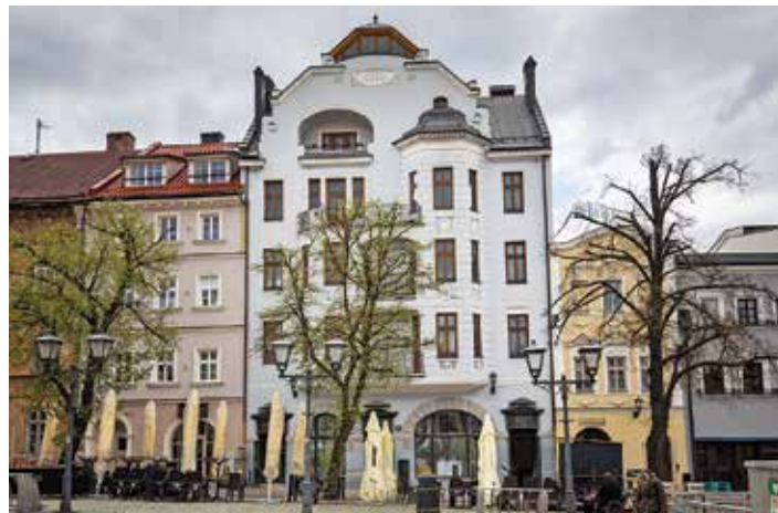
Kamienica przy ul. Wzgórze 11 oraz ta na Rynku pod numerem 11 zostaną poddane rewitalizacji w tym roku

Na sesji 18 lutego br. radni przyjęli sprawozdanie za lata 2019-2020 z realizacji Programu Rewitalizacji Obszarów Miejskich w Bielsku-Białej na lata 2014-2020 (Kontynuacja PROM 2007-2013) sporządzone przez Wydział Strategii i Rozwoju Gospodarczego Urzędu Miejskiego. Z informacji otrzymanych od projektodawców wynika, że epidemia koronawirusa niekorzystnie wpłynęła na realizację zaplanowanych projektów. Część z nich nie mogła być wykonana ze względu na ograniczenia, część podmiotów ze względów ekonomicznych wstrzymało działania. Ponadto projektodawcy, którzy planowali pozyskać finansowanie z Unii Europejskiej jako beneficjenci programów operacyjnych, otrzymali – na podstawie ustawy o szczególnych rozwiązaniach wspierających realizację programów operacyjnych w związku z wystąpieniem Covid-19 – instrumenty prawne do modyfikowania umów i decyzji o dofinansowaniu na etapie realizacji projektów, w celu dostosowania ich warunków do zmian wynikających z epidemii. Wszystko to miało wpływ na założone w PROM terminy realizacji. Aby umożliwić projektodawcom dalsze korzystanie z finansowania UE (np. w ramach wciąż dostępnych środków z pożyczki rewitalizacyjnej), bielska Rada Miejska podjęła uchwałę o kontynuacji w 2021 roku działań ujętych w PROM i wydłużeniu ich realizacji do końca bieżącego roku.