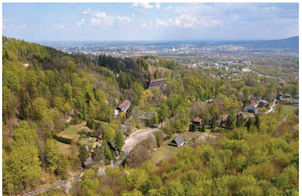
Zdjęcie okolic dojazdu pod Szyndzielnię z drona