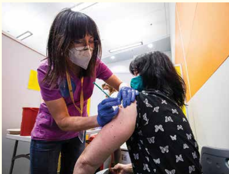
Pierwsze szczepienie w samorządowym punkcie szczepień