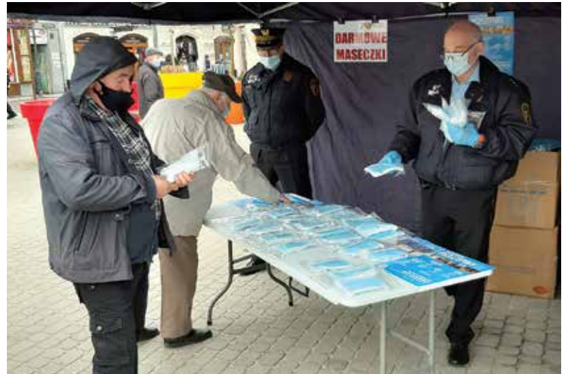
Straż Miejska rozdawała maseczki na pl. Wojska Polskiego