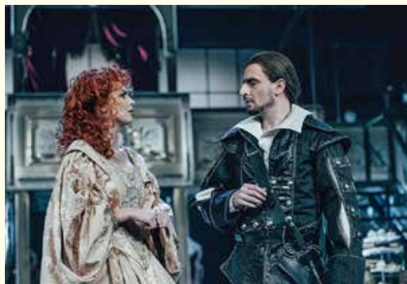
Cyrano de Bergerac