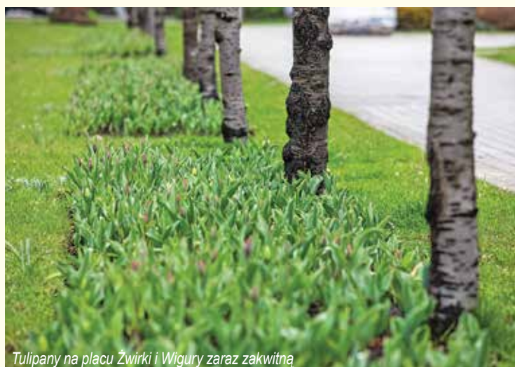
Tulipany na placu Żwirki i Wigury zaraz zakwitną

Bielsko-Biała będzie na wiosnę tego roku jeszcze bardziej kolorowe niż wcześniej. Do charakterystycznych miejsc w mieście, w których kwiaty pojawiały się w ubiegłych latach, doszły bowiem kolejne. To plac Żwirki i Wigury oraz rondo obok kościoła Opatrzności Bożej. W sumie w całym mieście posadzonych zostało 30.000 wiosennych kwiatów.