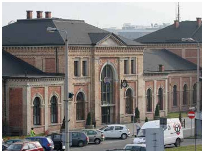
Budynek dworca w Bielsku-Białej

Spotkania konsultacyjne odbędą się w formie wideokonferencji on-line przy wykorzystaniu oprogramowa-