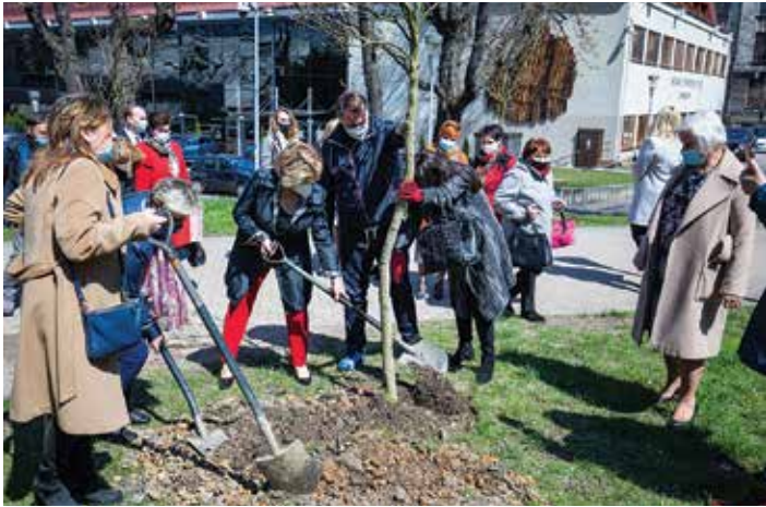
Sadzenie magnolii obok Bielskiego Centrum Kultury