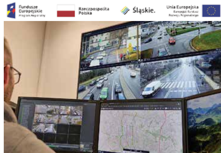
Centrum zarządzania systemem ITS

Znaczącymi aspektami są też: poprawa stanu środowiska naturalnego poprzez ograniczenie zanieczyszczeń powietrza z sektora transportowego, dwutlenku węgla i hałasu, zwiększenie przepustowości dróg miejskich, szersze wykorzystanie bardziej efektywnego transportu publicznego oraz zmniejszenie liczby wypadków.