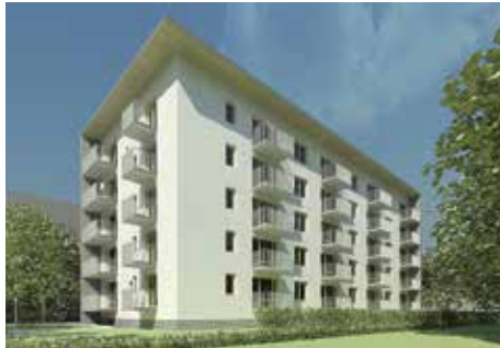
OMETRIA WARIANT 2 - WIDOK OD POŁUDNIA

Wysokość czynszu najmu w mieszkaniach wybudowanych w ramach społecznego budownictwa czynszowego wynosi 4 procent wartości odtworzeniowej lokalu mieszkalnego, a szczegółowe zasady regulują zapisy ustawy o niektórych formach popierania budownictwa mieszkaniowego. Wartość odtworzeniowa jest