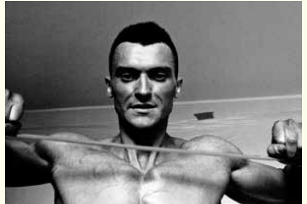
Na zdjęciach: po lewej: Krajobraz / Elementy i struktury Tadeusza Króla, fot. Krzysztof Morcinek powyżej: zdjęcie autorstwa Tomka Sikory