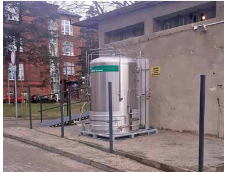
fol. Beskidzkie Centrum Onkologii – Szpital Miejski

– Ale to nie wszystko. Ogromne podziękowania dla firmy, która nas obsługuje w zakresie tlenu, bo bardzo się