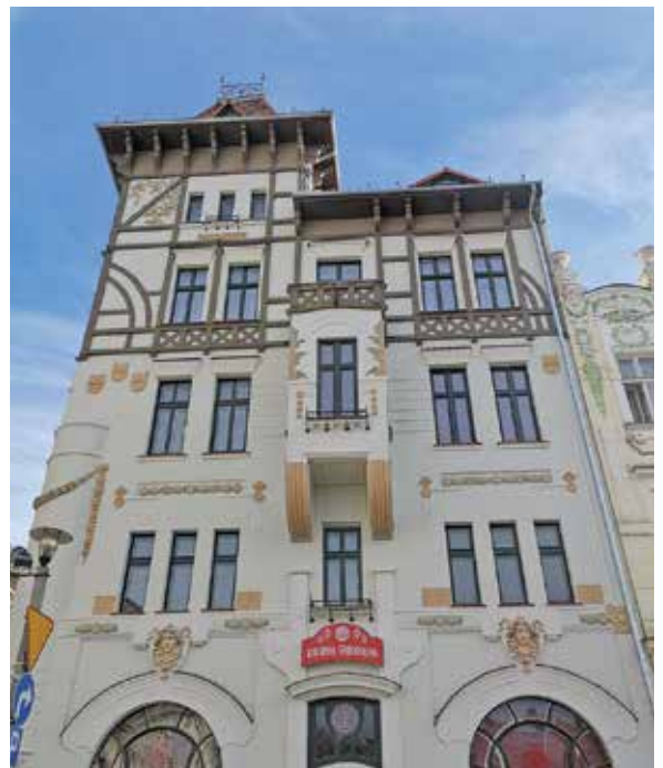
Kamienica Pod żabami