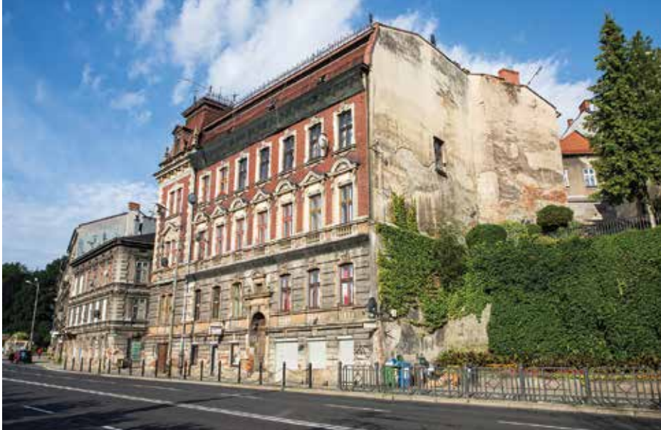
Budynek przy ul. Zamkowej 8

Cztery zabytkowe obiekty odzyskają blask m.in. dzięki finansowemu wsparciu miasta Bielska-Białej. Są to kamienice przy ulicach 3 Maja 13 i 17, ul. Norberta Barlickiego 4 oraz ul. Zamkowej 8.