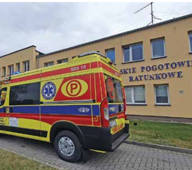
fol. Starostwo Powiatowe w Bielsku-Białej