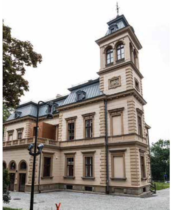
Willa Teodora Sixta