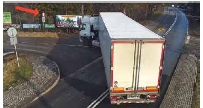
Zbyt ciężkie TIRy niszczą nawierzchnię