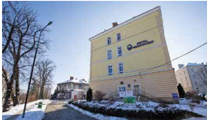
Budynek Szpitala Pediatrycznego