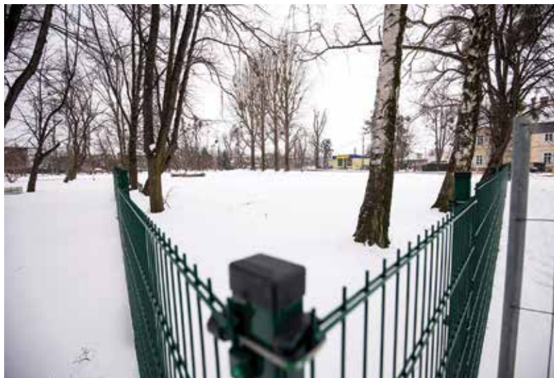
Na tym terenie powstanie nowy parking

O parkingu w Wapienicy, który powstanie dzięki wsparciu samorządu województwa śląskiego, piszemy poniżej. Jack