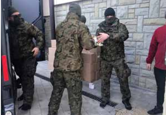
Żołnierze WOT dystrybuują dary