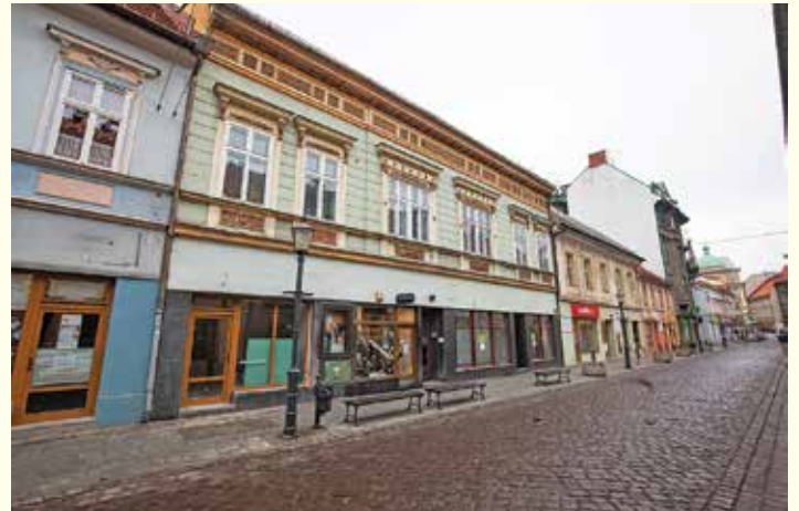
Budynek przy ul. 11 Listopada 24

– Pracujemy teraz nad koncepcją nowego budynku – punktem wyjścia do