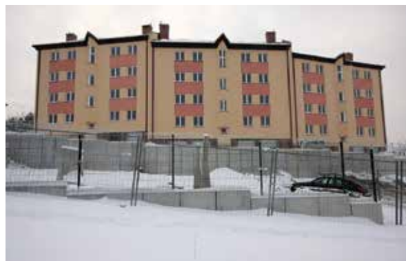
Jeden z wcześniej wybudowanych bloków komunalnych przy ul. Wapiennej / Ludwika Solskiego