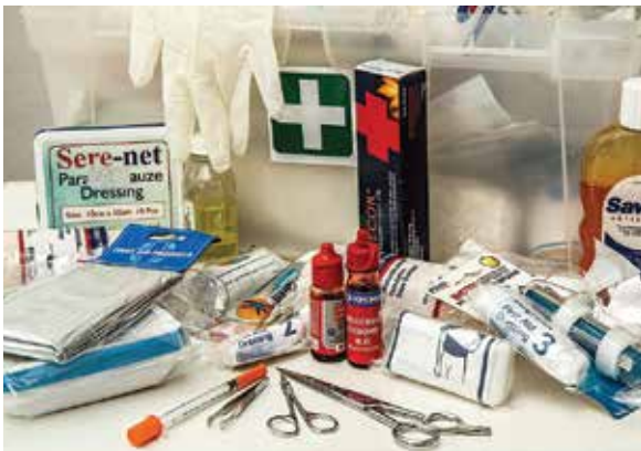
Środki opatrunkowe i leki do apteczek

Caritas Diecezji Bielsko-Żywieckiej, za pośrednictwem Caritas Polska, otrzymała od Agencji Rezerw Materiałowych produkty spożywcze z długim terminem przydatności do spożycia. Makaron, mąka, cukier, konserwy mięsne i rybne, warzywa konserwowe, gotowe dania, herbata oraz olej – trafiły do potrzebujących z naszej diecezji.