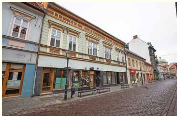
Budynek przy ul. 11 Listopada 24

– Pracujemy teraz nad koncepcją nowego budynku – punktem wyjścia do