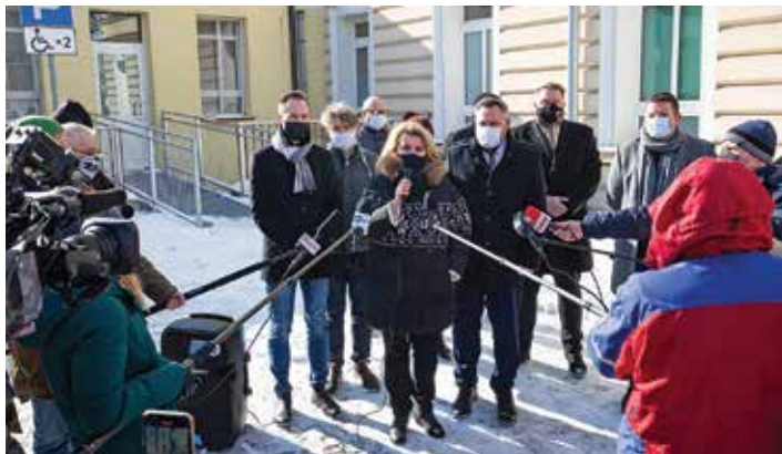
Konferencja prasowa przed szpitalem

Podczas sesji 18 lutego Rada Miejska przyjęła stanowisko w sprawie krytycznej sytuacji finansowej Szpitala Pediatrycznego w Bielsku-Białej. 15 lutego przed szpitalem odbyła się konferencja prasowa dotycząca tej placówki z udziałem parlamentarzystów i samorządowców.