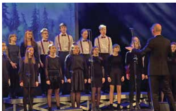
Ave Sol pod dyr. Marcina Pollaka

Młodzieżowy Chór Mieszany Ave Sol – działający w Bielskim Centrum Kultury – został wyróżniony złotym dyplomem na 8. Międzynarodowym Festiwalu Kołęd i Pastorałek w Rzeszowie, organizowanym przez tamtejsze Studium Muzyki Liturgicznej. Ave Sol zdobył złoty dyplom w kategorii chórów dziecięcych i młodzieżowych w konkursie, którym brało udział blisko 30 chórów i zespołów.