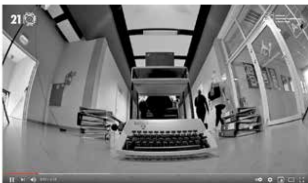
Dokuczliwość Prawa Parkinsona czyli rzecz o czasie 10 minutowe | 21.02.2021