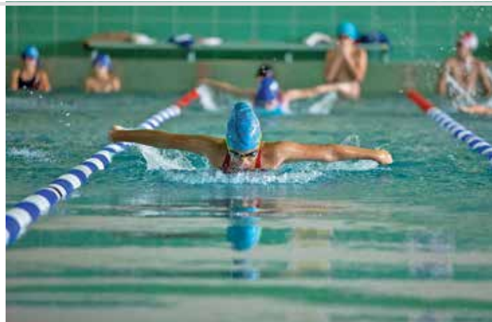
Miejskie zawody pływackie

W połowie stycznia br. miasto przekazało klubom biorącym udział w konkursie ofert pieniądze z tegorocznej puli na ten cel – w sumie 1.785.000 zł. Dotacje zostały przyznane na 52 projekty. Dofinansowane dyscypliny to: piłka nożna dziewcząt, piłka nożna chłopców, piłka siatkowa dziewcząt, piłka siatkowa chłopców, koszykówka chłopców, lekkoatletyka, judo, ju-jitsu, boks, kick-boxing,