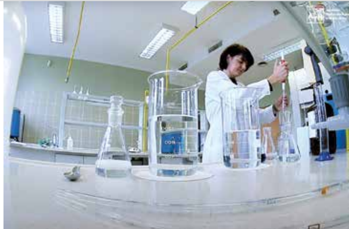
Kadr z filmu Czego nie wiemy, a powinniśmy... o wodzie

– Od lat ta impreza wpisała się w kalendarz najważniejszych wydarzeń w naszym mieście, dlatego zapraszam państwa na ten wyjątkowy festiwal,