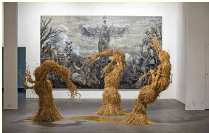
Pole bitwy