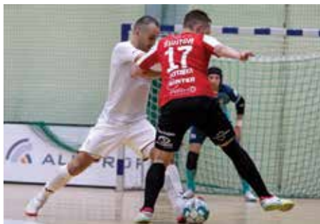
Mecz Rekordu z Red Devils Chojnice