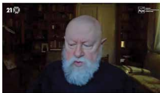
7 Beskidzkie Dyktando Festiwalowe dla uczniów szkół średnich i dorosłych 011 minutowe | 21.02.2021

Tekst dyktanda dla starszych uczestników przygotował profesor Jerzy Bralczyk