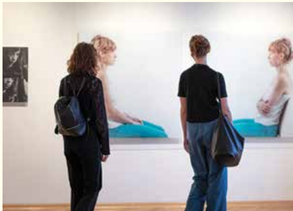
Miłośnicy sztuki oglądają wystawy w Willi Sixta

– W końcu powiew sztuki, brakowało mi jej jak tlenu – wyznał jeden z pierwszych widzów, którzy przyszli we wtorek 2 lutego do otwartej po kilkumiesięcznej przerwie Galerii Bielskiej BWA.