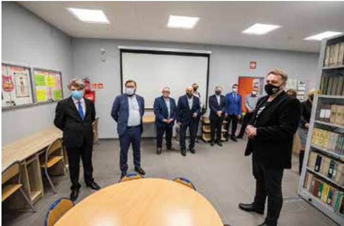
Goście oficjalnego otwarcia sali