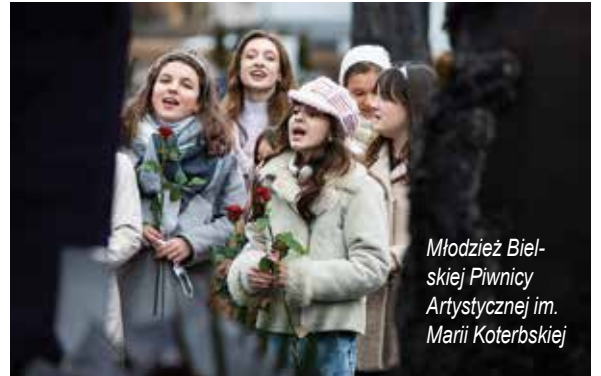
Młodzież Bielskiej Piwnicy Artystycznej im. Marii Koterbskiej