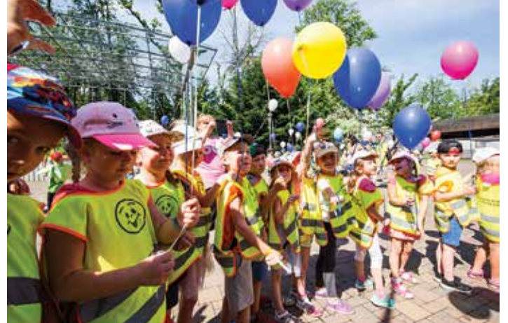
Na zdjęciu uczestnicy Beskidzkiego Festiwalu Dobrej Energii w 2019 roku

Natomiast kampania promocyjno-edukacyjna Bielsko-Biała chroni klimat to odpowiedź na wyzwania środowiskowe dotyczące całej Europy. Jest przykładem innowacyjnej kooperacji społecznej, mającej pomóc w osiągnięciu unijnych celów klimatycznych na poziomie lokalnym. Kampania została uruchomiona w 2011 roku, a na rok 2019 przypadła jej 9. edycja. Intencją przedsięwzięcia jest zaangażowanie jak największej liczby mieszkańców i podmiotów lokalnych w miejską strategię energetyczno-środowiskową oraz promocja ekologicznego stylu życia, a także edukacja w zakresie oszczędzania energii.