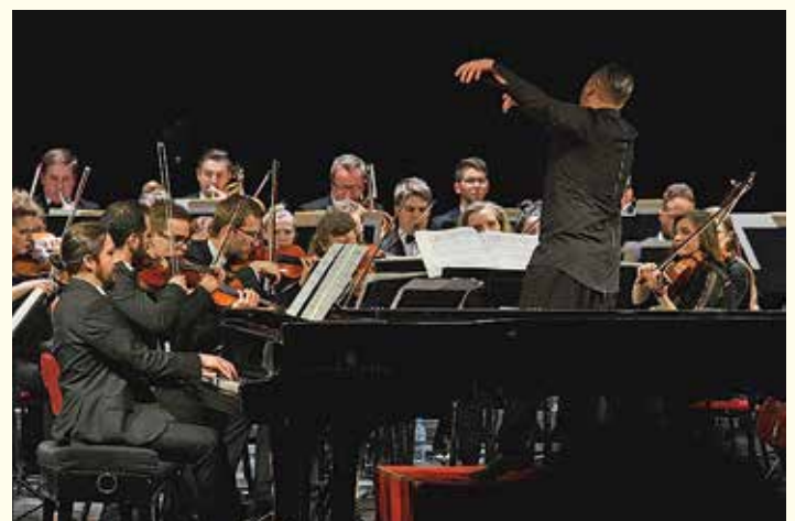
Bielska Orkiestra Kameralna

W związku z panującą epidemią Bielskie Centrum Kultury informuje, że program imprez może ulec zmianie, o wszystkich zmianach BCK informuje na bieżąco na stronie www.bck.bielsko.pl . Bilety zakupione na imprezy przeniesione na nowy termin zachowują ważność i nie trzeba ich wymieniać. Ze względu na regulacje związane z pandemią, BCK zastrzega sobie możliwość zmiany miejsc. wag