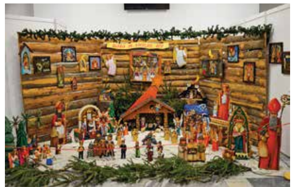
Wystawa prac państwa Szypułów