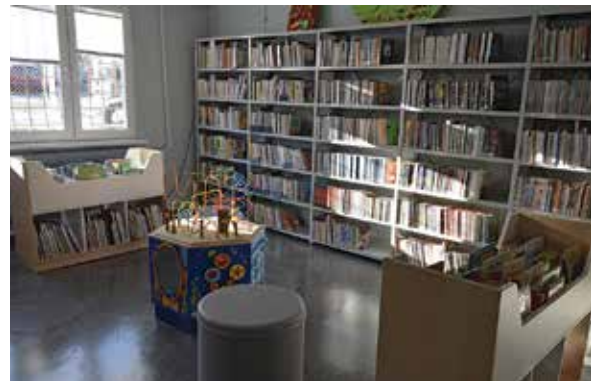
Nowe regały w Filii KB na Osiedlu Beskidzkim