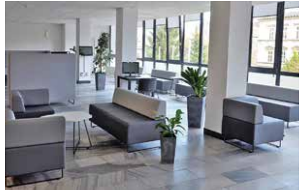
Nowy salonik prasowy w gmachu głównym KB