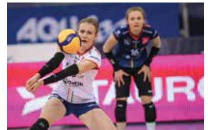
Mecz siatkarski BKS Bostik