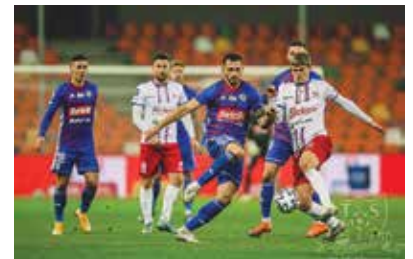
Mecz Podbeskidzia