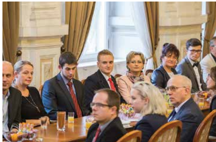
Spotkanie ze stypendystami w sali sesyjnej Ratusza w 2017 r.

Miejski program stypendialny zakłada również pracę z wybitnie uzdolnionymi uczniami, promowanie ich wyników, nagradzanie osiągnięć, a jednocześnie szkolenie nauczycieli z zakresu pracy ze zdolnym uczniem i współpracę z jego rodzicami. Po rozpoznaniu szczególnych uzdolnień ucznia szkoła opracowuje indywidualny program pracy z nim, może też proponować indywidualny tok nauki, zachęcać do udziału w kołach zainteresowań, a wyniki ucznia upowszechniać, eksponować i nagradzać. Formą nagrody są właśnie jednorazowe stypendia edukacyjne prezydenta miasta.