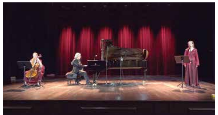
Film-koncert Na drodze do niepodległości