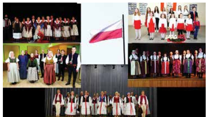
Zespoły powiatu bielskiego śpiewają Mazurka Dąbrowskiego