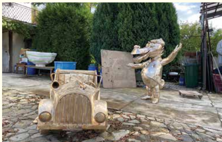
Smok Wawelski i jego samochód czekają na przejazd na pl. Wojska Polskiego