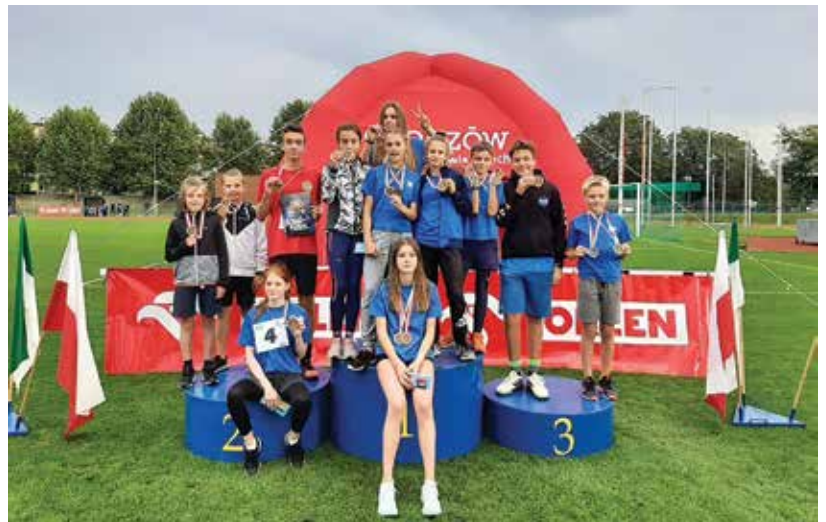
Zawodnicy KS Sprint z medalami