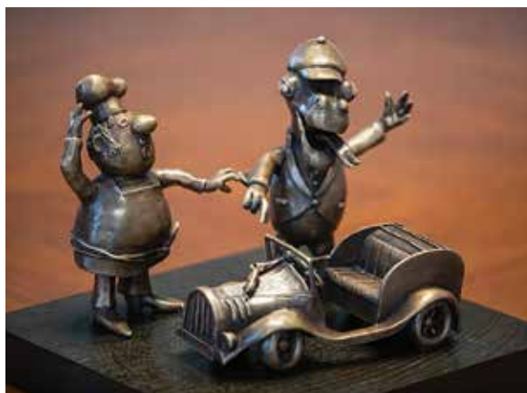
Projekt nowej rzeźby na bajkowym szlaku