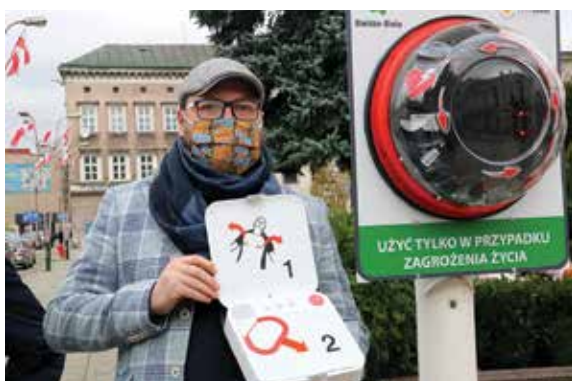
Z-ca prezydenta Adam Ruśniak prezentuje jedno z urządzeń

Jeszcze bezpieczniej jest w przestrzeni publicznej Bielska-Białej. 10 defibrylatorów zainstalowano w różnych częściach miasta. Pierwszy z nich został umieszczony na placu Wojska Polskiego.