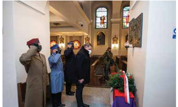
Prezydent wraz z przedstawicielami służb mundurowych złożył wiązanki kwiatów także pod tablicami w kościele Trójcy Przenajświętszej