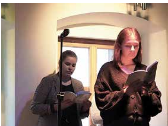
Spotkanie literatów w Galerii Wzgórze