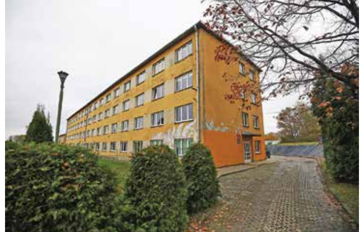
CUW będzie działać w budynku przy ul. Akademii Umiejętności 1a

– Przejęcie wspólnej obsługi przyczyni się do ujednoczenia procedur i procesów, co pozwoli na oszczędności podczas zakupu sprzętów i systemów, a także lepsze wykorzystanie sprzętu oraz infrastruktury. Zminimalizowane