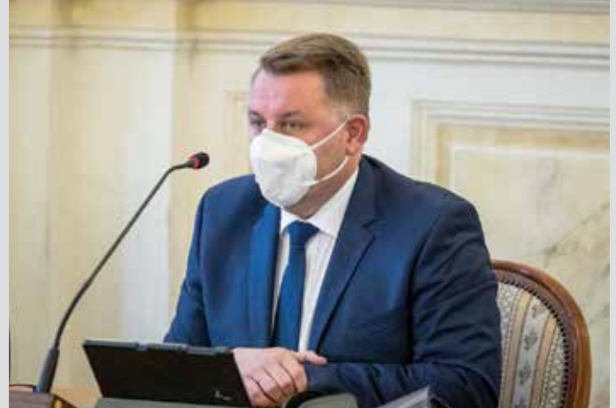
Prezydent Bielska-Białej Jarosław Klimaszewski

Sytuacja pandemiczna wpłynęła niekorzystnie na bardzo wiele zadań realizowanych przez samorządy. Jednym z nich jest transport publiczny. W Bielsku-Białej, w porównaniu do ubiegłego roku, odnotowano znaczący spadek sprzedaży biletów Miejskiego Zakładu Komunikacyjnego. Straty z te-