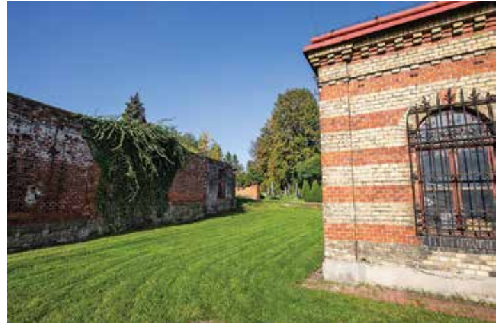
Miejsce, gdzie powstanie lapidarium na cmentarzu żydowskim