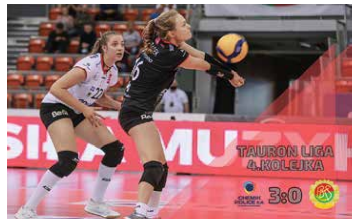
fot. materiały klubu BKS