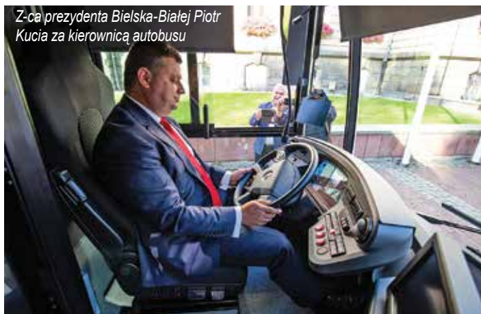
Z-ca prezydenta Bielska-Białej Piotr Kucia za kierownicą autobusu