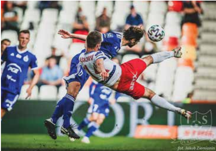
Mecz Pdbeskidzie – Stal