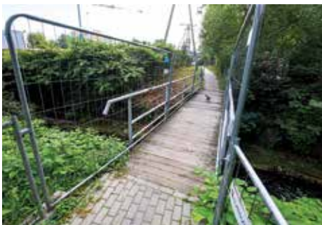
Stara kładka przy ul. Celtyckiej

Miejski Zarząd Dróg przystąpił do realizacji zadania Budowa kładki pieszo-rowerowej na rzece Wapienica wraz z dojazdami w Bielsku-Białej w rejonie ul. Celtyckiej. Zakres robót obejmuje rozbiórkę istniejącej oraz budowę nowej kładki wraz dojazdami – chodnikiem i dojazdami – ścieżką rowerową, przebudowę kolidującej linii napowietrznej średniego napięcia, budowę oświetlenia zewnętrznego. Prace potrwają do grudnia br. Na czas robót ruch pieszy odbędzie się kładką tymczasową. oprac. Jack