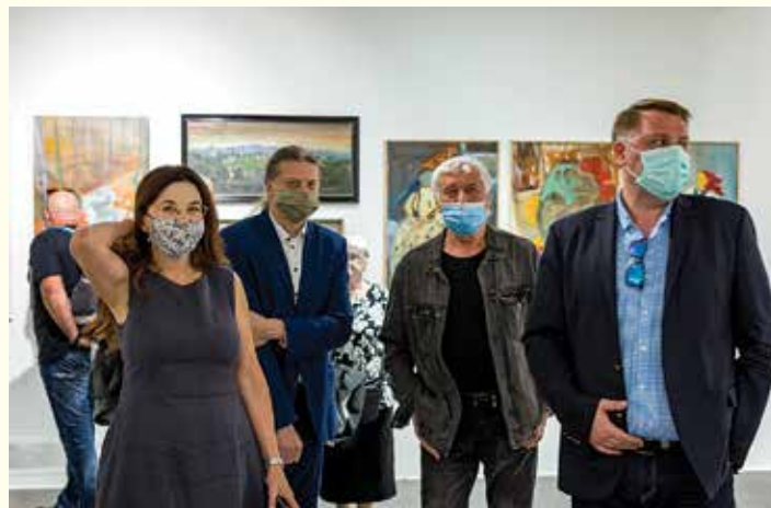
Oficjalni goście na wystawie w BWA