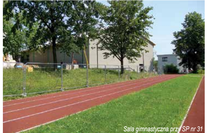
Sala gimnastyczna przy SP nr 31

Zespół Szkół Elektronicznych, Elektrycznych i Mechanicznych przy ul. Juliusza Słowackiego w ramach unijnego dofinansowania modernizuje bazę dydaktyczną dla kształcenia zawodowego. Zadanie składa się z trzech elementów. Pierwszy to roboty budowlane, już zakończone, drugim jest przetarg na dostawę platformy przyschodowej potrzebnej do tego, aby inwestycja była dostępna dla osób niepełnosprawnych.