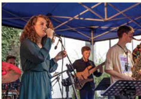
Gra sextet jazzowy