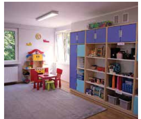
Sala w Przedszkolu nr 54