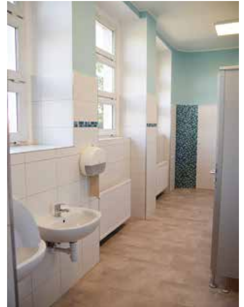
Łazienka w Szkole Podstawowej nr 3

Przy tworzeniu artykułu korzystano z materiałów Miejskiego Zarządu Oświaty w Bielsku-Białej