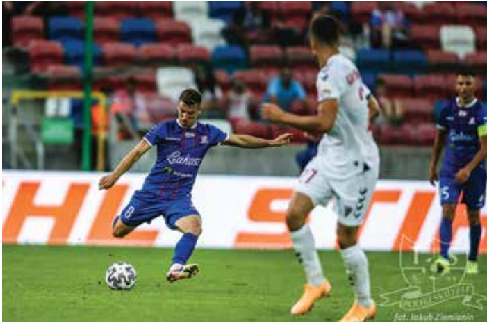
Podbeskidzie - Górnik