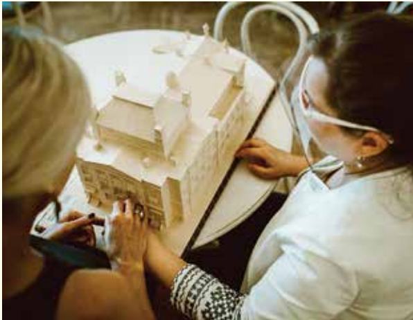
Tyflograficzna makieta teatru