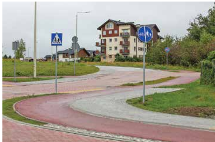
ul. K. Sosnkowskiego