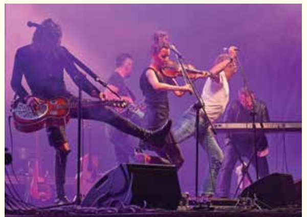
koncerty z 7, 8, 14 i 15 sierpnia