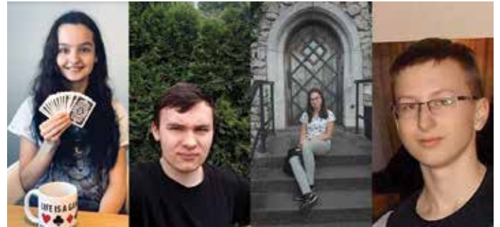
Drużyna Beskidzkiego Stowarzyszenia Brydża Sportowego Olimpijczyk