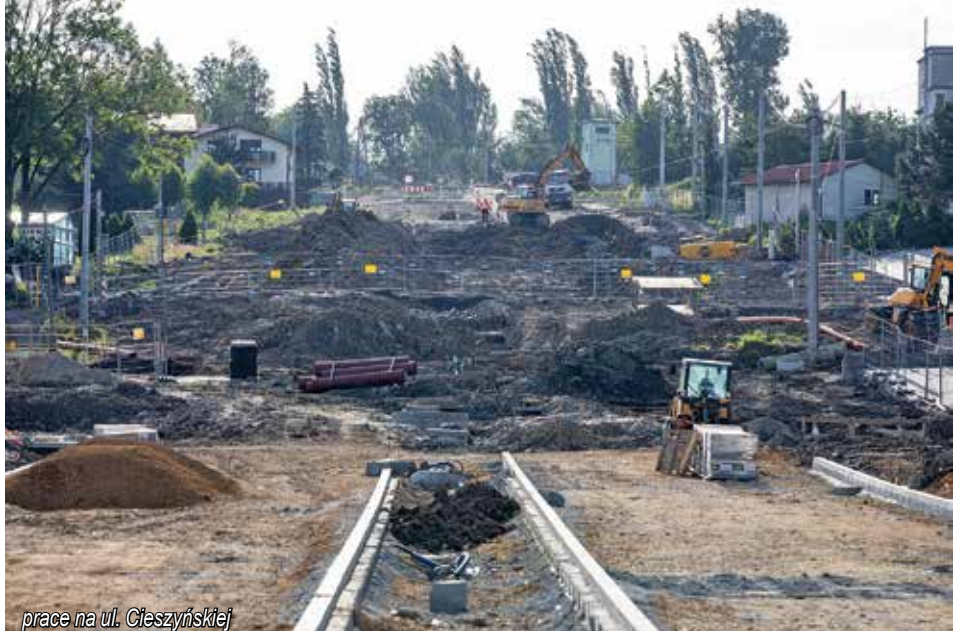
prace na ul. Cieszyńskiej

Jak wszystko dobrze pójdzie, przejezdność na tej trasie MZD planuje uzyskać do końca tego roku, jednak na razie trudno powiedzieć w jakim kształcie. Na pewno będzie to dyspozycji co najmniej jedna jezdnia. Obecnie nie jest łatwo wyrokować, czy będzie szansa na to, aby pod koniec roku ruch mógł się tam odbywać po obu jezdniach. Wszystko wskazuje na to, że drogowcy zdecydują się na podobny manewr, jak zastosowano na modernizowanej do niedawna ul. Żywieckiej. To oznacza, że droga uzyska przejezdność, a ostatnia warstwa ścieralna, która przy nakładaniu jest bardzo wrażliwa na warunki atmosferyczne, położona zostanie