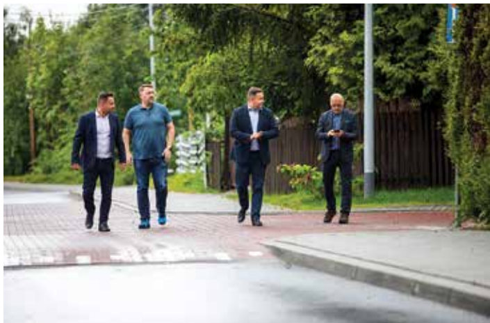
wizytacja na ul. Wczasowej

Zakończyły się prace budowlane na trzech ulicach w mieście. Bielszczanie i goście mogą wygodnie korzystać z przebudowanych ulic Wczasowej, gen. Kazimierza Sosnkowskiego oraz Jaworzańskiej.