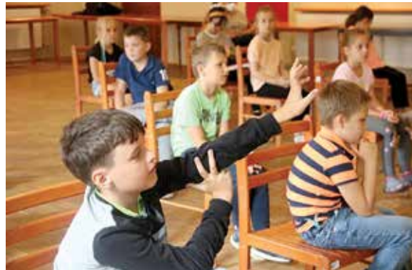
uczestnicy spotkania na temat bezpieczeństwa w wakacje

– Fundacja od lat wspiera działania, które mogą się przyczynić do poprawy bezpieczeństwa wszystkich użytkowników dróg. Jednym z takich działań są spotkania w okresie letnim z dziećmi uczestniczącymi w półkoloniach. Omawiamy bezpieczne zachowania na drodze; mówimy też, jak zachowywać się na wakacjach, żeby były one bezpieczne. Trzeba unikać zagrożeń na drodze,