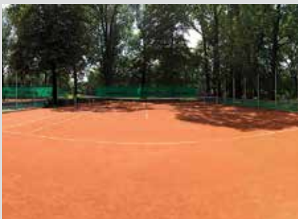
fol. BKT Advantage

Kolejne korty tenisowe pojawiły się w Parku Rosta przy ul. Ceramicznej. Beskidzki Klub Tenisowy Advantage dysponuje już sześcioma profesjonalnymi kortami ziemnymi, pozwoli to w sezonie letnim na organizację w Bielsku-Białej imprez międzynarodowych oraz mistrzostw kraju. Budowa nowych kortów tenisowych była kolejnym krokiem w rozwoju klubu, w którym trenują na co dzień czołowi polscy tenisiści w różnych kategoriach wiekowych. Oczywiście BKT Advantage to nie tylko sport wyczynowy. Klub proponuje również zajęcia indywidualne oraz grupowe dla dzieci, młodzieży i dorosłych na każdym poziomie zaawansowania. Zajęcia prowadzą wykwalifikowani trenerzy oraz instruktorzy posiadający akredytację Polskiego oraz Czeskiego Związku Tenisowego.