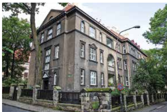
budynek przy ul. Lubertowicza 3