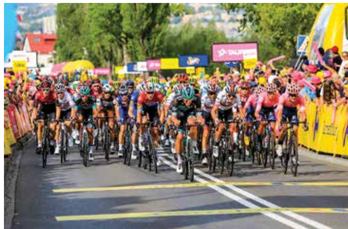
zeszłoroczny finisz bielskiego etapu TdP

Jak podkreślają organizatorzy, o losach wyścigu może zdecydować czwarty, królewski etap Bukovina Resort – Bukowina Tatrzańska. Finałowy