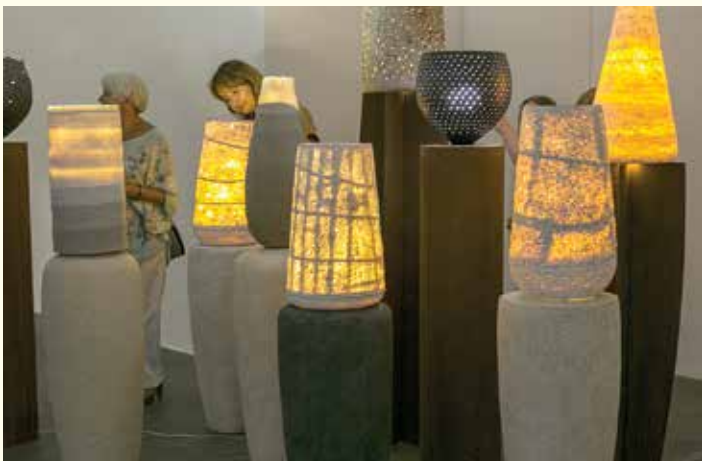
Wystawa Poblask