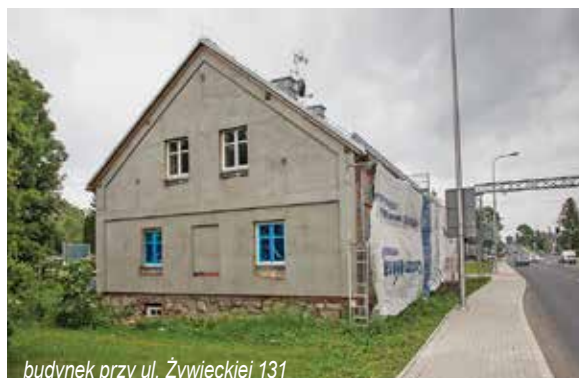
budynek przy ul. Żywieckiej 131

Remonty są podzielone na etapy, część z nich zakończy się w tym roku, część w przyszłym. Całe zadanie zostanie wykonane do końca 2021 roku.