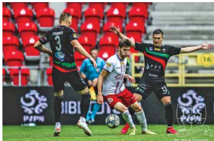
Mecz w Tychach

W 73. minucie nadszedł ten moment! Najpierw Bashlai wygrał ważny