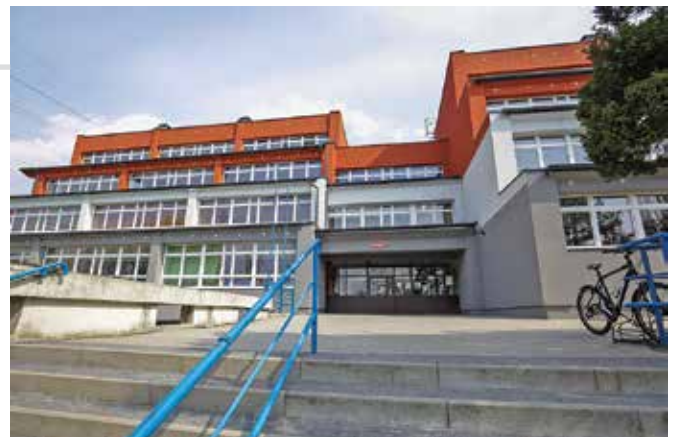
Liceum Ogólnokształcące im. Adama Asnyka

Matura w tym roku jest wyjątkowa. Z powodu epidemii maturzyści zdają egzaminy tylko pisemnie, za wyjątkiem tych osób, które muszą przedłożyć wyniki egzaminów ustnych podczas rekrutacji na uczelnie zagraniczne.