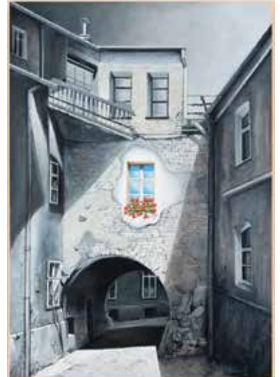
Tadeusz Józefowicz, Okno niebieskie