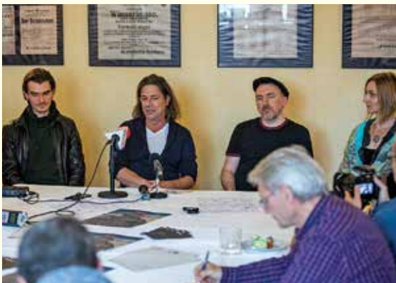
konferencja prasowa z twórcami spektaklu

Od 2013 roku jest związany z Teatrem Polskim. To aktor o dużych możliwościach scenicznym, który z powodzeniem podejmuje zróżnicowane wyzwania aktorskie, tworząc postaci interesujące i świetnie zgrane z konwencją czy stylem spektakli. Znakomicie sprawdza się zarówno w repertuarze klasycznym, jak i współczesnym. Jego błyskotliwy talent komediowy objawił się w takich tytułach, jak Mayday czy Hotel Westminster , dostarczając sporą dawkę scenicznego humoru. Widzowie bielskiej sceny z pewnością zapamiętali jego tytułowe role w takich przedstawieniach, jak Wujaszek Wania , Makbet i Cyrano de Bergerac , a także jego kreacje w Humance , Mistrzu i Małgorzacie czy w spektaklu Miarka za miarkę . □