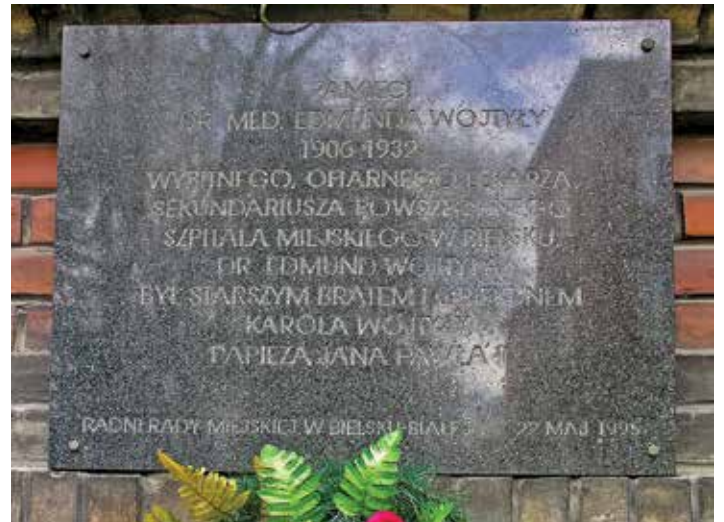
Tablica poświęcona Edmundowi Wojtyłcie

w której w 1916 r. urodziła się i zmarła siostra papieża, Olga Wojtyła: ul. Szkolna 12.