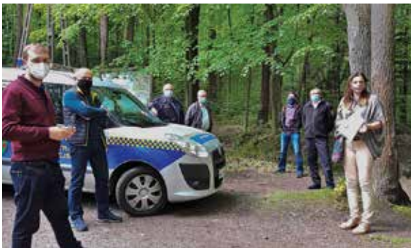
spotkanie w Cygańskim Lesie

ski nad realizacją objętych dokumentacją robót. Wyloniona w przetargu firma będzie miała dziesięć miesięcy na realizację projektu. Jack