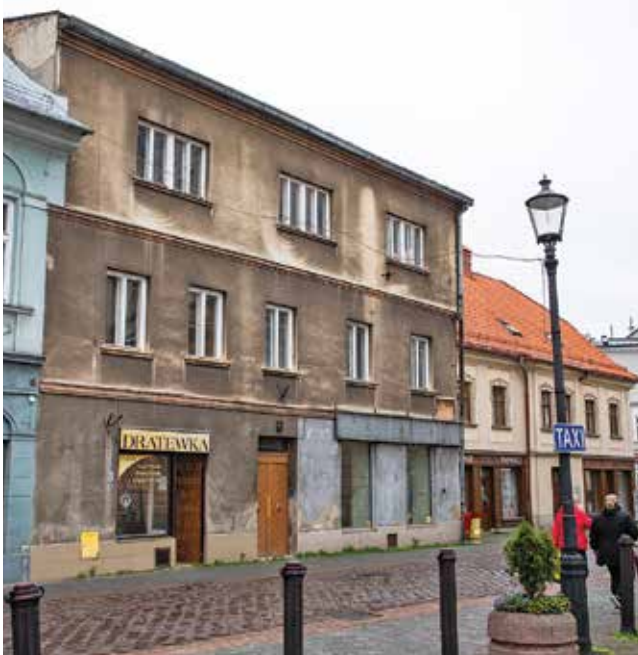
W tej kamienicy będzie działać Akademia Wiedzy Istotnej

Akademia Wiedzy Istotnej powstanie w ramach programu Rewitalizacji obszarów miejskich w Bielsku-Białej na lata 2014-2020. Będzie działać w budynku przy ul. 11 Listopada 56 / ul. Głębocka 5 jako miejsce edukacji i integracji społecznej.