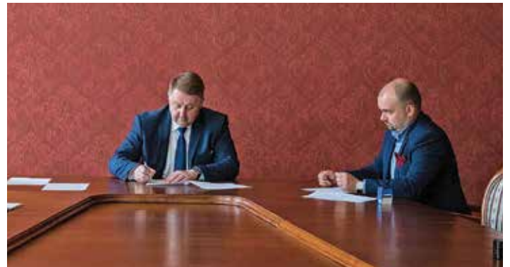
podpisanie umowy dotyczącej powstania Synergii

– Spółdzielnia Socjalna Synergia powołana przez miasto Bielsko-Biala oraz gminę Kozy ma pomóc w zatrudnieniu osób, które wymagają wsparcia w powrocie na rynek pracy. Są to m.in. osoby bezrobotne czy z niepełnosprawnościami i na tym się skupimy. Pracow-