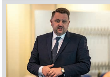
mówi prezydent Bielska-Białej Jarosław Klimaszewski:

Projekt Nowoczesna baza Beskidzkiego Centrum Onkologii – Szpitala Miejskiego im. Jana Pawła II w Bielsku-Białej jest dofinansowany ze środków Regionalnego Programu Operacyjnego Województwa Śląskiego na lata 2014-2020 na podstawie umowy o dofinansowanie z 24 lipca 2018 r. Całkowita wartość projektu wynosi ok. 119 mln zł, a wartość dofinansowania ze środków Europejskiego Funduszu Rozwoju Re-