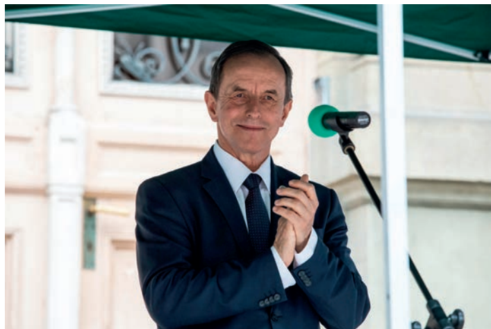
Marszałek Senatu RP Tomasz Grodzki

– Chcę wyrazić ogromną radość i podziękować za zaszczyt zaproszenia do złożenia wizyty na Podbeskidziu. Z Bielskiem-Białą łączą mnie miliony wspomnień. Mam tu nie tylko znakomych kolegów lekarzy, ale i wspaniałe wspomnienia z czasów, kiedy jako student bardzo często bywałem tu, udając się na narty do Szczyrku, Zwardonia czy Wisły. Doceniam ogromnie to miasto, gdyż nawet podczas dzisiejszego przejazdu przez nie mogłem dostrzec, jak wiele zmieniło się tutaj na lepsze. Nie do wiary, jak Bielsko zmieniło się w trakcie tych 30 lat – mówił marszałek Tomasz Grodzki. – To państwo udowodniacie, że reforma samorzą-