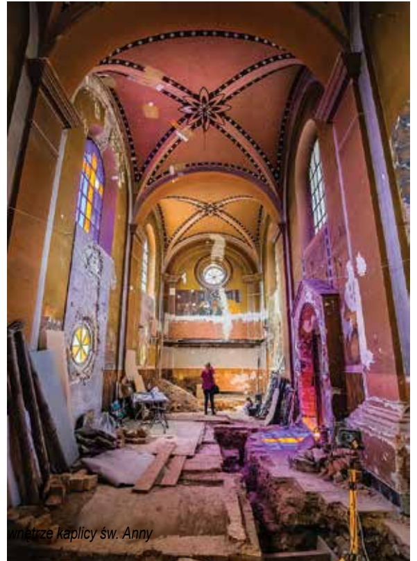
Wnętrze kaplicy św. Anny