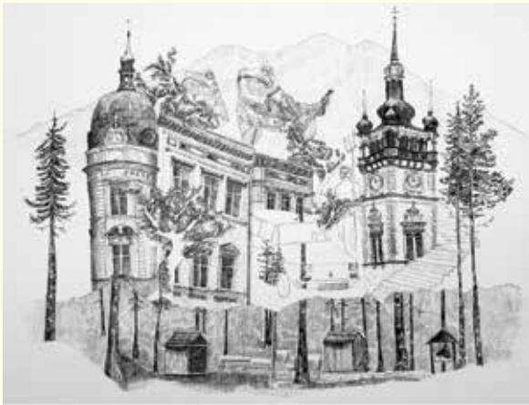
Amelia Tylika I miejsce, kategoria - szkoły średnie