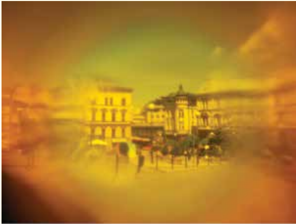
Roksana Brodacz GRAND PRIX