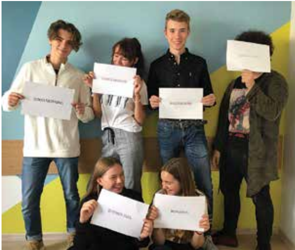
Uczniowie Akademickiego Dwujęzycznego Liceum Oxford Secondary School w Bielsku-Białej