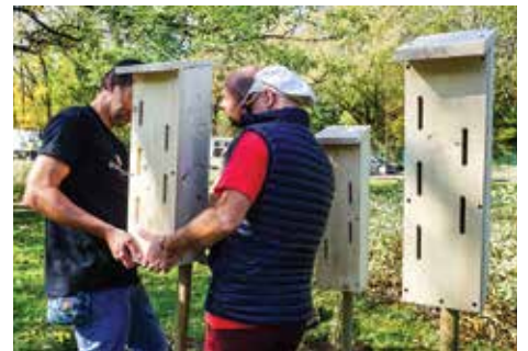
Budki lęgowe dla motyli

nić motyloom pokarm i sadzić rośliny kwitnące. W ten sposób tworzymy warunki do bytowania nie tylko motyli, ale także wielu innych gatunków owadów, zapewniając im zasoby kwiatowe. I najważniejsze – powinniśmy zostawiać dzikie zakażki na skwerach, w parkach i ogrodach. Populacja owadów zapylających drastycznie maleje głównie z powodu utraty siedlisk, a także stosowania pestycydów, chorób i zmian klimatu. Spadek populacji owadów zapylających wpływa negatywnie nie tylko na ludzi i społeczności, ale także na ekosystemy.