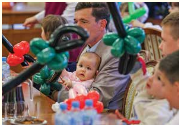
Uroczystość inauguracyjna działania programu w 2010 r.