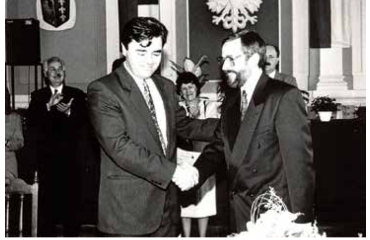
Podpisanie jednej z pierwszych umów partnerskich