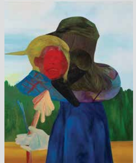
Dominika Kowynia, Próba cofania , 2019

Film można oglądać na Facebooku Białaluki i stronie internetowej www.bialaluka.pl oraz na kanale YouTube. □