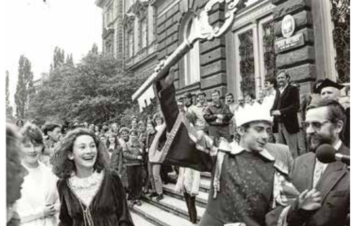
Rozpoczęcie Dni Bielska-Białej, młodzież odbiera klucz do miasta