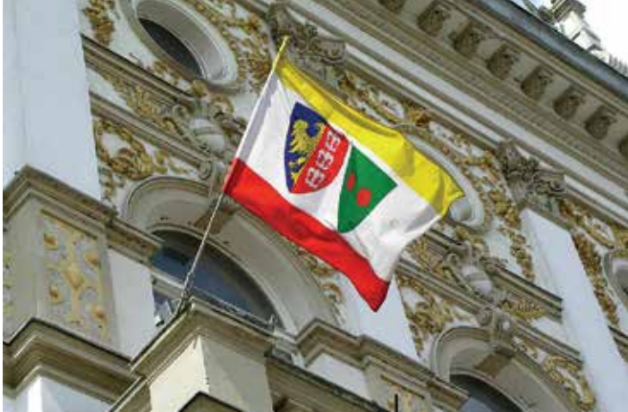
Miejska flaga na Ratuszu