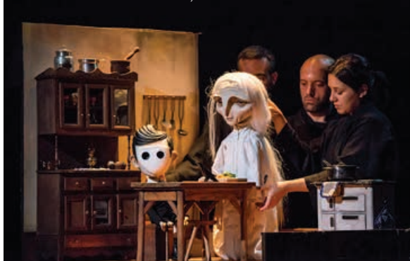
Teatro de Marionetas do Porto, Kitsune