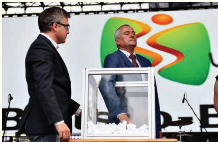
BIELSKO-BIAŁA I JEGO ŚWIĘTO – dokończenie ze str. 1

W spotkaniu uczestniczyli – biskup pomocniczy diecezji bielsko-żywieckiej Kościoła rzymskokatolickiego Piotr Greger, parlamentarzyści, radni, szefowie instytucji i firm, szefowie miejskich spółek i naczelnicy wydziałów.