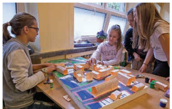
Warsztaty w SP 22

Pomysły i opinie będą też podstawą do stworzenia koncepcji przekształceń przestrzeni w rejonie Teatru Polskiego i ulicy Bohaterów Warszawy. Zarys tej koncepcji zostanie poddany publicznej dyskusji jeszcze przed wakacjami. opr. Jack