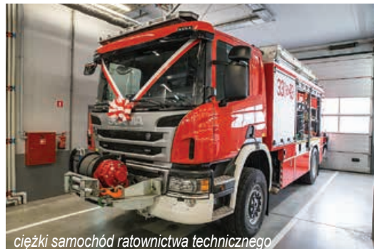
ciężki samochód ratownictwa technicznego

we, znacząca część tej inwestycji została sfinansowana z Wojewódzkiego Funduszu Ochrony Środowiska i Gospodarki Wodnej. W 2018 r. samorząd Bielska-Białej przeznaczył 150 tys. zł na dofinansowanie naszych poczynań – mówił bryg. Zbigniew Mizera. – Przed nami poświęcenie nowych pojazdów – samochodu terenowego, który zastępuje wysłużonego Land Rovera, oraz naszego najnowszego pojazdu – ciężkiego samochodu ratownictwa technicznego Skania za ponad 2 mln 200 tys. zł. Ten ostatni samochód został zakupiony z projektu Usprawnienie systemu ratownictwa w transporcie kolejowym z funduszy europejskich oraz z budżetu państwa. Oba samochody zastępują wysłużone ponad 20-letnie pojazdy – dodał komendant miejski PSP w Bielsku-Białej.