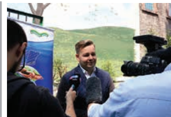
ZIELONE PŁUCA MIASTA dokończenie ze str. 1