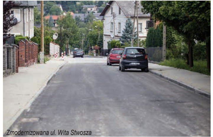
Zmodernizowana ul. Wita Stwosza