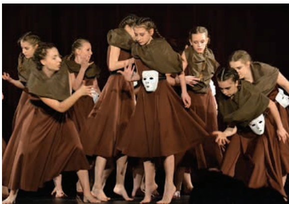
Fenomen, fot. Monika Sowa, DK Kamienica