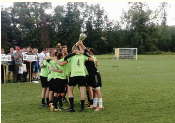
Zwycięzcy strażacy z KMP PSP Bielsko-Biała