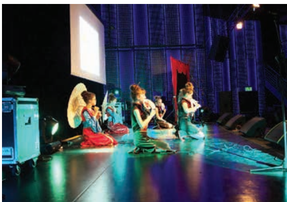
Festiwal piosenki bajkowej, fot. z archiwum organizatorów