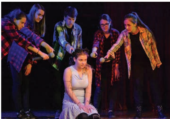
Bielskie Spotkania Teatralne