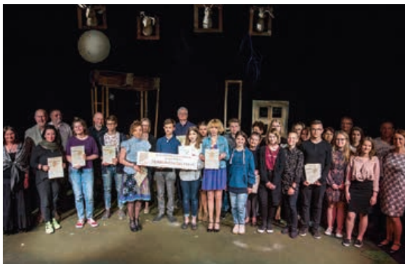
Uczestnicy, opiekunowie, jurorzy i organizatorzy konkursu Przebudzeni do Życia 2018