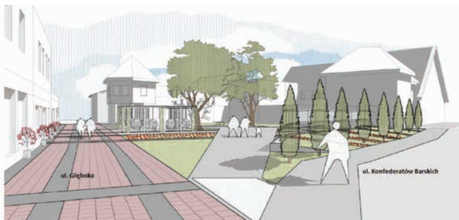
Koncepcja zagospodarowania placu między ulicami Głęboką i Konfederatów Barskich

W ramach pilotażu w 2016 r. interdyscyplinarne zespoły projektowe składające się z doświadczonych ekspertów oraz studentów uczelni wyższych z województwa śląskiego pracowały nad koncepcjami organizacyjno-projektowymi dotyczącymi niewielkich przestrzeni w czterech miastach: Jastrzębiu-Zdroju, Siemianowicach Śląskich, Rudzie Śląskiej oraz Żorach. W związku z pozytywną oceną przedsięwzięcia przez przedstawicieli tych miast w tym roku postanowiono zorganizować kolejną jego edycję, w której udział wzięło miasto Bielsko-Biała. opr. Jack